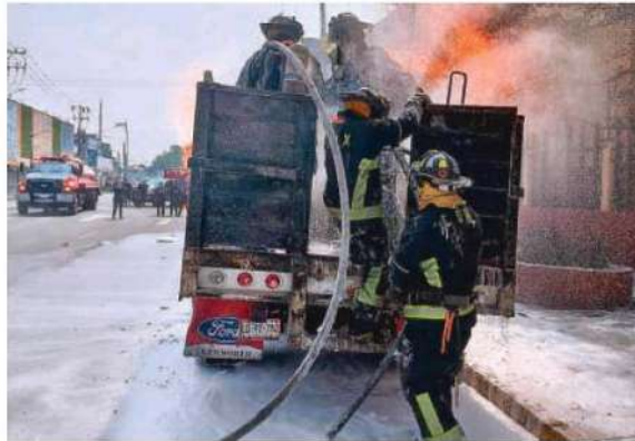
Los bomberos informaron que no hubo afectaciones a los edificios cercanos