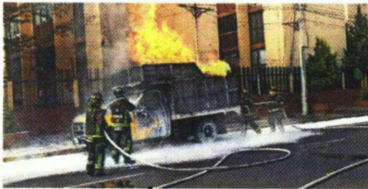
VALENTE ROSAS EL GRÁFICO

UN CAMIÓN repartidor de GAS LP se incendió sobre el Eje 8 Sur y Calzada de la Viga, en la COLONIA CHURUBUSCO , de la alcaldía COYOACÁN . Fueron alrededor de 30 CILINDROS los que estuvieron expuestos a las LLAMAS por lo que BOMBEROS los enfriaron con agua para evitar que EXPLOTARAN . No se reportaron personas lesionadas.