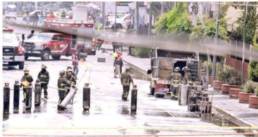
Los hechos ocurrieron sobre la Avenida Ermita Iztapalapa entre la Calzada de La Viga y Mexicaltzingo