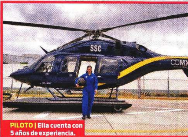
PILOTO | Ella cuenta con 5 años de experiencia.