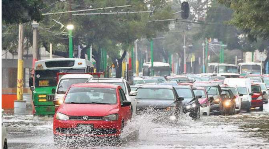
Principales afectaciones por las lluvias durante la tarde y noche del sábado se registraron en las alcaldías Tlalpan, Coyoacán e Iztapalapa /IGNACIO HUITZIL