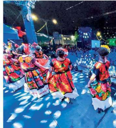
FELICES. En el transcurso de las fiestas, los asistentes disfrutaron de música, baile, antojos mexicanos y juegos mecánicos.

“Es de reconocer la colaboración de la ciudadanía para que estas actividades se llevarán a cabo en completo orden y se diera una verdadera fiesta”, apuntó. /24HORAS