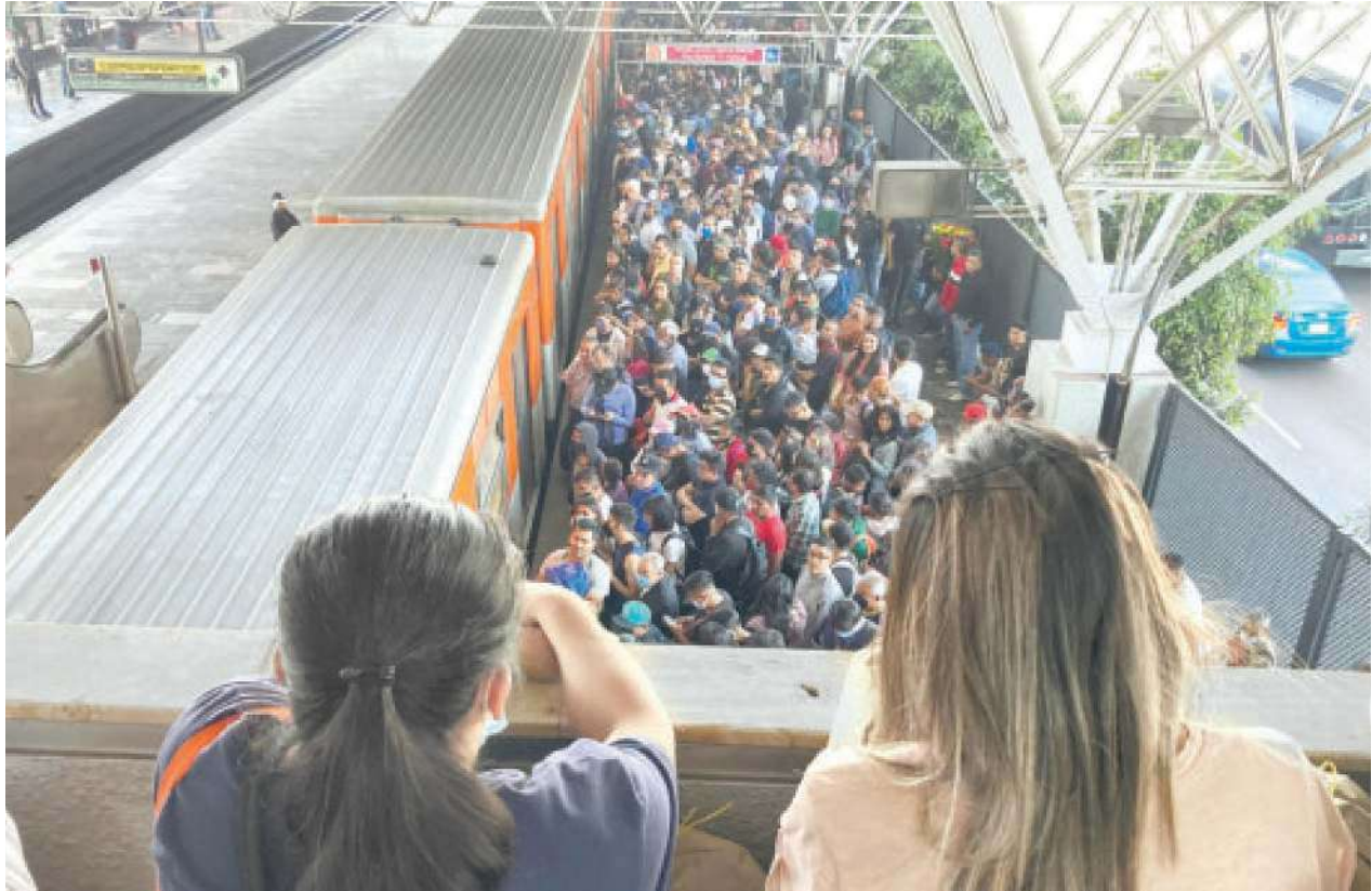
El programa Salvemos Vidas auxilia y apoya al interior del Metro