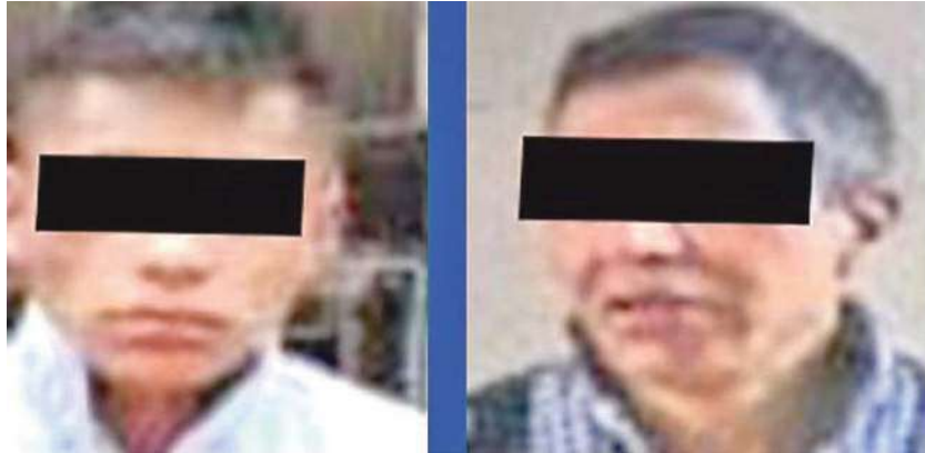
Este par de sujetos está relacionado en varios asaltos con violencia