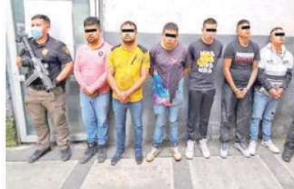
Pretendían realizar un "cobro de piso" a una empresa constructora

sión, "cobro de piso", y narcomenudeo, además de que se les achacan varios homicidios cometidos en la CdMx.