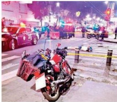
Motocicleta con una mochila de repartidor aún amarrada al asiento

Un hombre, de aproximadamente 35 años de edad, derrapó y terminó inconsciente sobre el pavimento, con una grave herida en el rostro. Su motocicleta, una Italka ZT 280 color gris con detalles en naranja, quedó tirada junto al camellón, sin placas y con rastros de sangre sobre el asfalto.