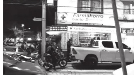
Investigan a los responsables

Peritos de la Fiscalía trabajan en la recolección de indicios balísticos y testimonios para esclarecer el motivo del ataque