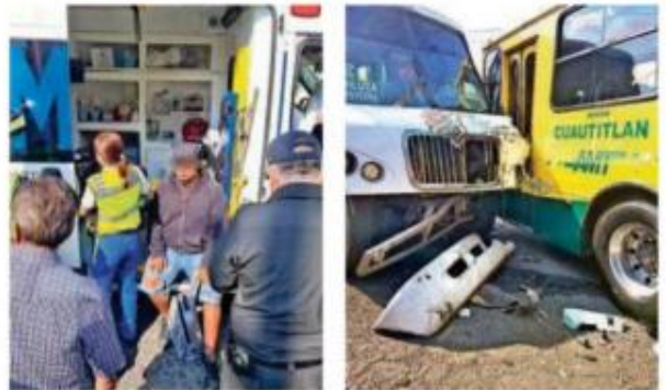
Paramédicos del ERUM y de Protección Civil atendieron a los lesionados en el lugar; choferes intentaron maniobrar, pero ya era demasiado tarde