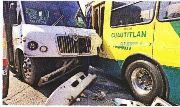
■ Supuestamente las unidades circulaban a exceso de velocidad y ambos choferes fueron detenidos.