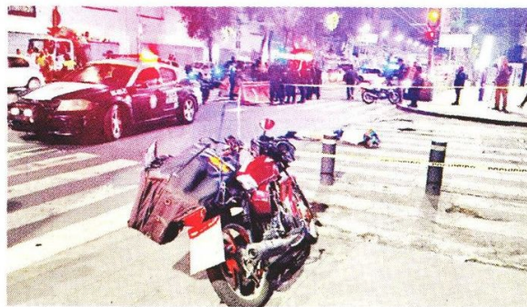
■ Un motociclista se llevó la peor parte tras atropellar a una persona en situación vulnerable que fue llevada al hospital.

motoristas muertos en hechos de tránsito durante 2025.