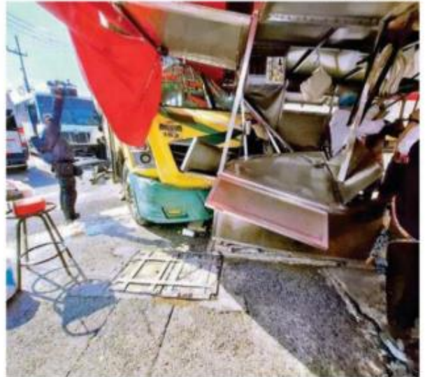
El golpe fue tan fuerte que una de las unidades terminó incrustada en un puesto semifijo, donde se vendían alimentos