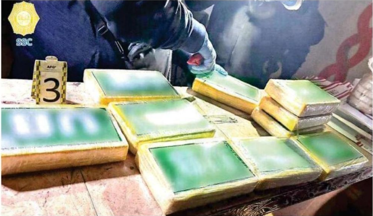
Asegurados diez paquetes confeccionados en forma de tabique con cinta canela y playo, que al interior contenían su- puesta cocaína