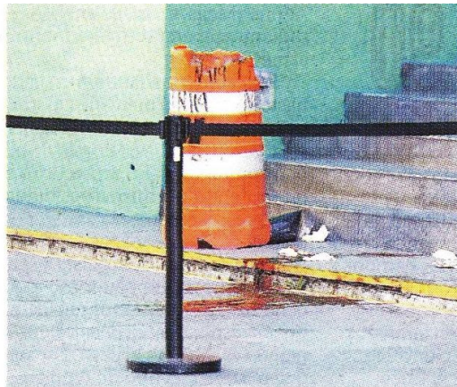
El litigante fue ejecutado en la Ciudad Judicial y la personas que le disparó ya fue detenida.