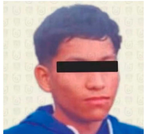
La madre el presunto criminal contrató a un abogado, en sustitución al jurista de oficio.

Los primeros avances de las indagatorias no han determinado cuál de los dos arrestados accionó el arma contra Cohen.