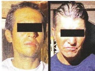
■ Con el Cártel de Tláhuac se les liga a los detenidos.