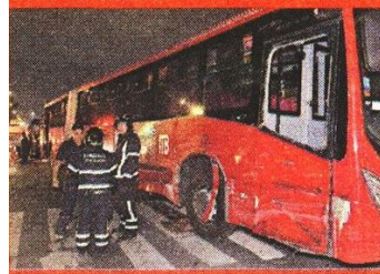
El autobús articulado también sufrió afectaciones.