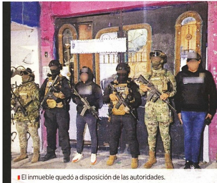
■ El inmueble quedó a disposición de las autoridades.

Según datos de la SSC, con la droga incautada se podrían haber elaborado 20 mil dosis individuales, con un precio en el mercado de aproximadamente 2 millones 300 mil pesos.