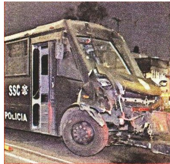
El camión costero de la SSC resultó con daños en el frente.

La dependencia explicó que se abrió una carpeta en Asuntos Internos.