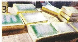
■ Se les decomisaron 10 paquetes de a kilo de cocaína.