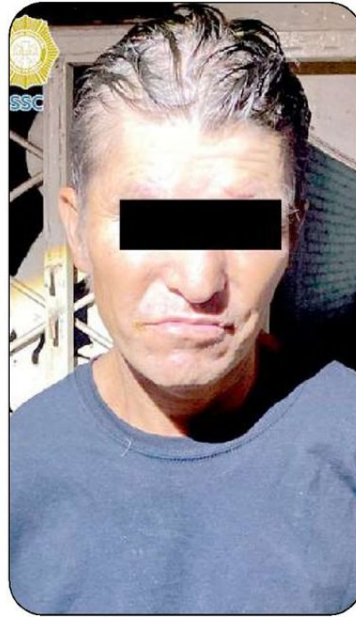
Sujetos detenidos, durante cateo a centro de drogas