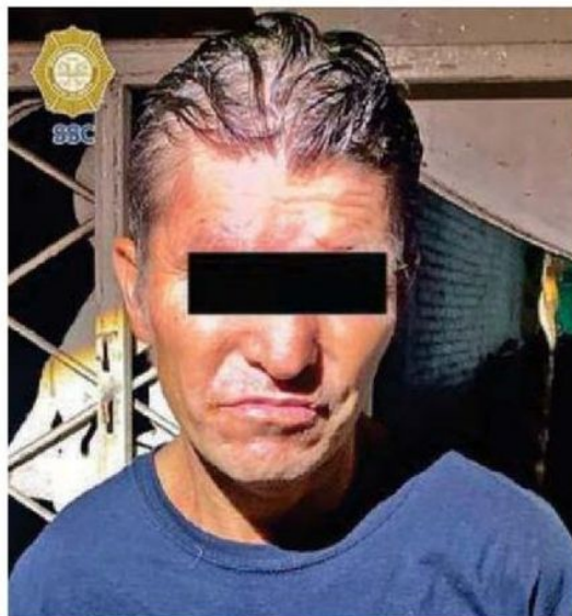
Durante el cateo detienen a dos hombres presuntos integrantes de Los 300