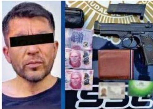
Detenido con algunas pertenencias de los usuarios