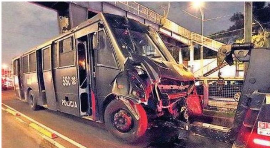
Aparatoso accidente con un Metrobús en Eduardo Molina y Héroe de Nacozañi