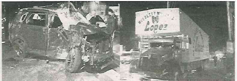
El conductor quedó atrapado entre su destrozada unidad

El aparatoso accidente se registró la madrugada de ayer en el