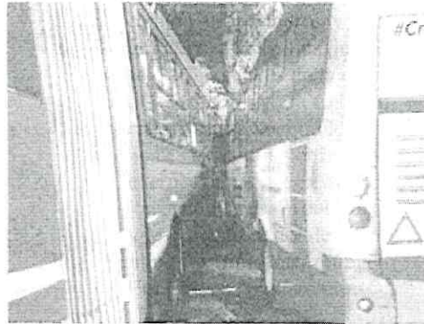
Fue una colisión de gigantes

Es probable que el exceso de velocidad de ambas unidades, sea el origen del percance