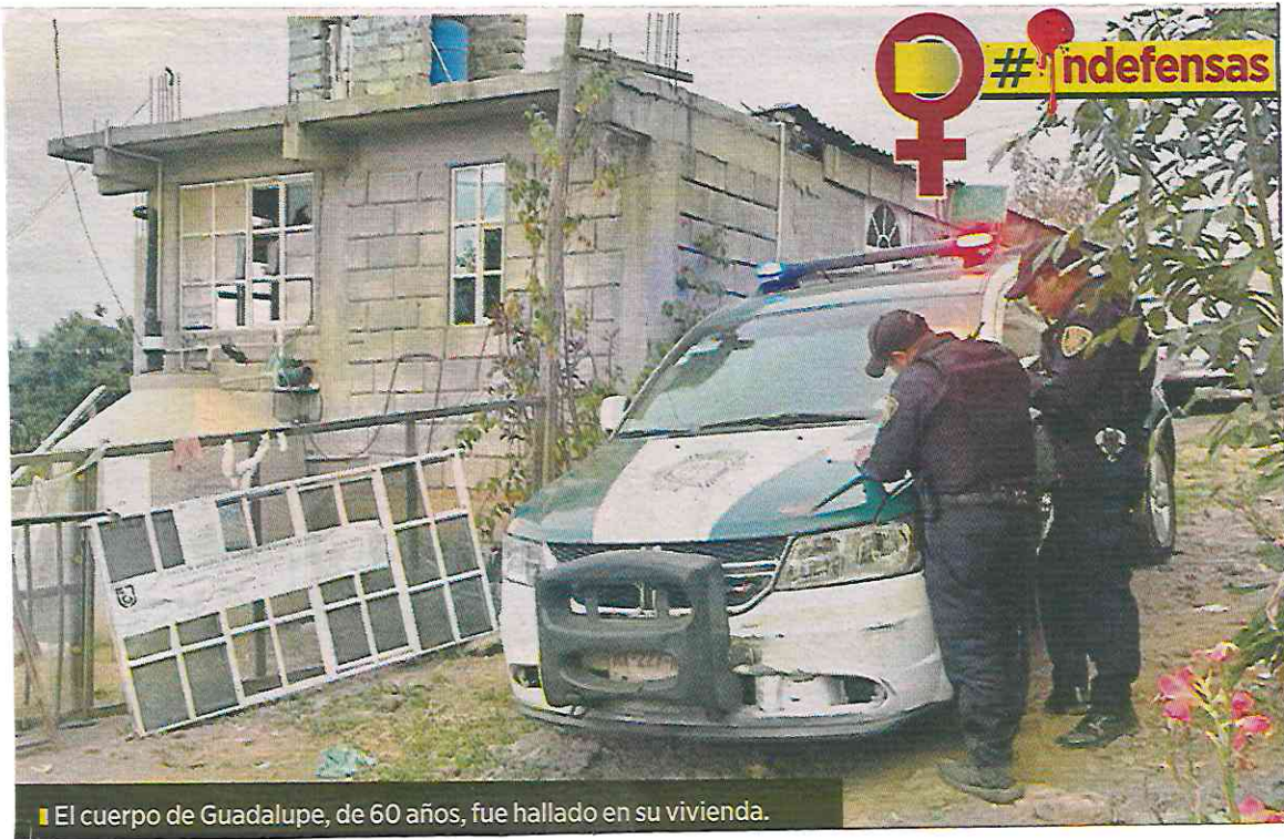
El cuerpo de Guadalupe, de 60 años, fue hallado en su vivienda.