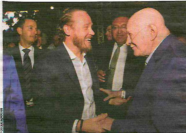
EL ALCALDE de Benito Juárez saluda al ex titular de la SSP, Manuel Mondragón y Kalb, al terminar el evento.

En esta iniciativa se propone que la fórmula de Blindar-BJ sea aplicada de manera institucional en todas las demarcaciones políticas de la capital.