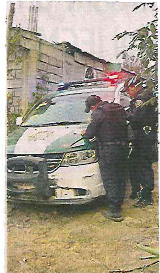
El inmueble en Milpa Alta quedó bajo resguardo policial.

Además, personal de la Fiscalía llevó a cabo un operativo en el domicilio de la Calle Sol, donde encontraron el cadáver de Guadalupe, supuestamente enterrado.