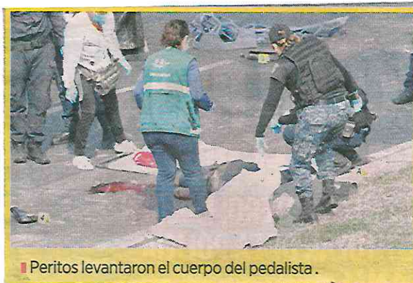
Peritos levantaron el cuerpo del pedalista.

El vehículo derribó un señalamiento vial y terminó encima de un camellón que divide la incorporación al distribuidor Periférico Sur-Cuernavaca.