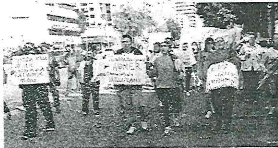
Se manifestaron por la reanudación de clases

Las clases de natación seguirán suspendidas en el colegio