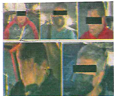
Los detenidos ofrecían boletos para el partido entre Pumas y Cruz Azul, dentro de la Copa por México

Cabe destacar que, a través de un cruce de información realizado en la base de