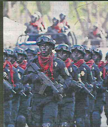
El jefe de la policía, Omar García Harfuch, encabezó el desfile.

Reconocen el valor de los agentes durante el segundo desfile