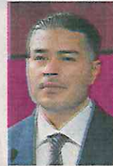
Omar García Harfuch

El marco de la celebración por el Día del Policía fue el escenario para que el Gobierno de la Ciudad de México mostrara el músculo de sus fuerzas policiales. A lo largo de la avenida Juárez y un tramo de Paseo de la Reforma más de 2 mil elementos de diferentes corporaciones desfilaron junto con caballos, vehículos y helicópteros. Frente al Hemiciclo a Juárez, la jefa de Gobierno, Claudia Sheinbaum , y el secretario de Seguridad Ciudadana, Omar García Harfuch , se encargaron de reconocer y apapachar a los elementos policiales y, sobre todo, de mandar el mensaje a la ciudadanía de que se construye a “la mejor policía del país”, y que la CDMX es una ciudad segura.