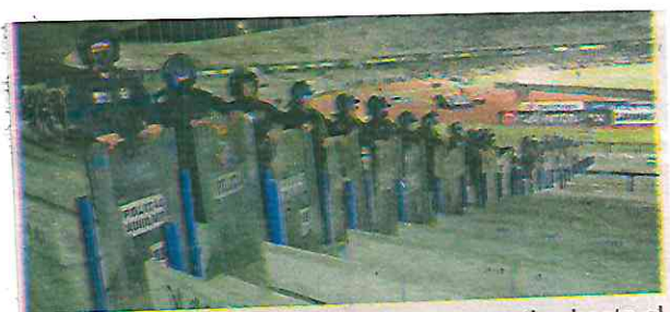
Policías mantuvieron el despliegue operativo hasta el término del partido y el desfogue de los aficionados

datos de esta dependencia, se supo que tres de los detenidos registran diversas presentaciones ante el Juez Cívico por el delito de Reventa.