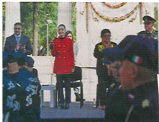
Omar García Harfuch, Claudia Sheinbaum y Ernestina Godoy en el desfile de policías capitalinos.

Los sicarios ocuparon ese momento para emparejar la motocicleta color negro con naranja, y después accionar el arma de fuego calibre 9 milímetros en varias ocasiones contra la camioneta. Luego de eso, ambas unidades escaparon. ●