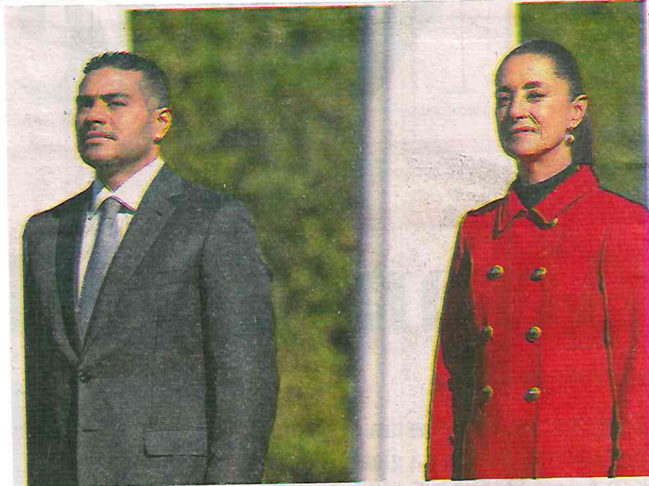
La jefa de Gobierno de la CDMX, Claudia Sheinbaum Pardo, y el titular de la SSC, Omar García Harfuch, en el Día del Policía

Sheinbaum Pardo resaltó que 2022 es el año en el que menos delitos de alto impacto se han cometido desde hace 15 años