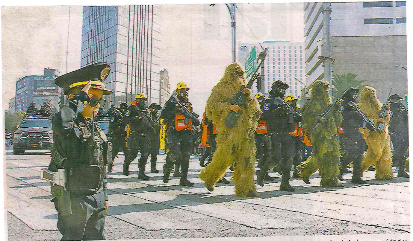
Los asistentes pudieron observar las diferentes áreas especializadas de la institución, con los cuales brindan seguridad y protección a los capitalinos