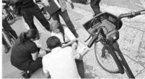
Persisten estos tipos de accidentes

Seguro de Ecobici no atiende a los usuarios de dicho servicio, denunciaron que el seguro del transporte público capitalino no atiende las peticiones de las personas.