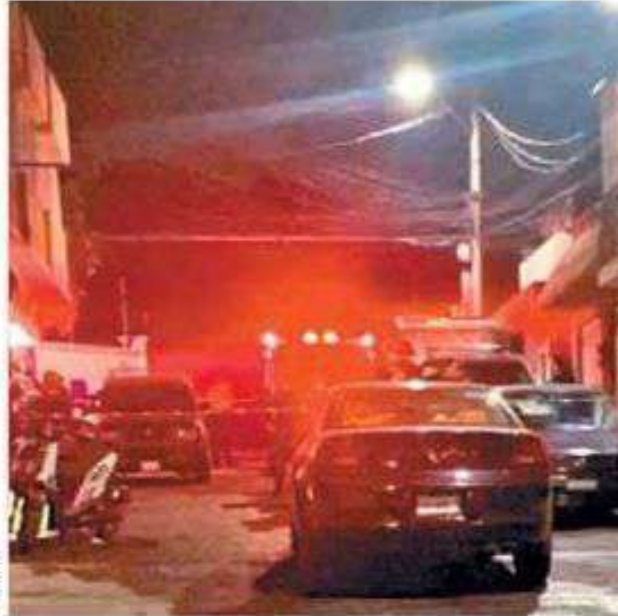
➤ La víctima perdió la vida tras este ataque suscitado en San Juan Xalpa.

La zona quedó bajo resguardo de la autoridad ministerial, al tiempo que indagan si hay pistas de los homicidas.