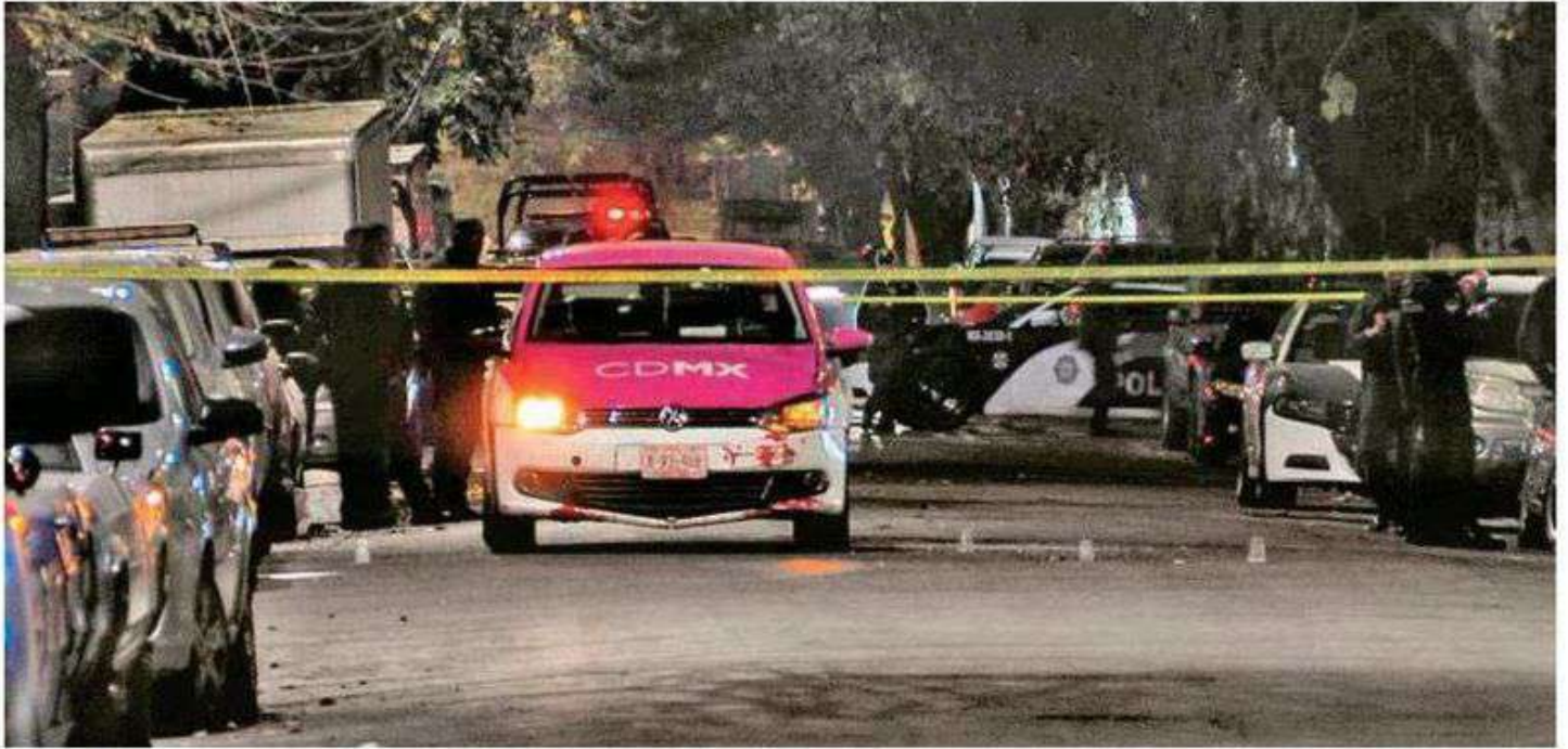
Los presuntos agresores de inmediato emprendieron la huida, sin que los presentes pudieran observar sus características específicas