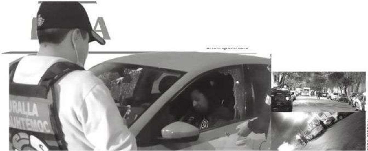
- El hoy occiso tenía antecedentes delictivos por robo