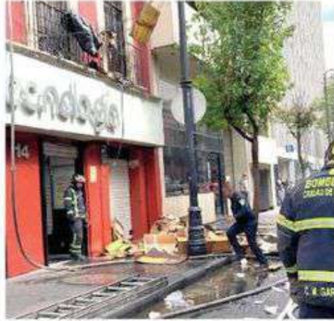
Ardió la parte alta

Hasta el momento se ignora qué provocó el fuego, lo cual ya es investigado por las autoridades capitalinas.