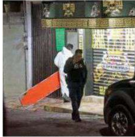
La mujer quedó tendida boca abajo, sobre un charco de sangre, mientras que el hombre permaneció recostado aún con signos vitales

Cuando la zona estaba siendo acordada, habitantes del lugar se acercaron para intentar enterarse de lo ocurrido, sin que nadie pudiera ubicar a los baleados por nombre. Ahí permanecieron observando la escena desde la cinta amarilla.