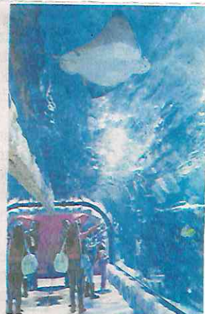
El acuario dijo que se siguió el protocolo de emergencia.

"Aunque no existen lesiones externas en el cuerpo de la víctima [se] atrajo el expediente para establecer si pudo existir o no responsabilidad en protocolos"