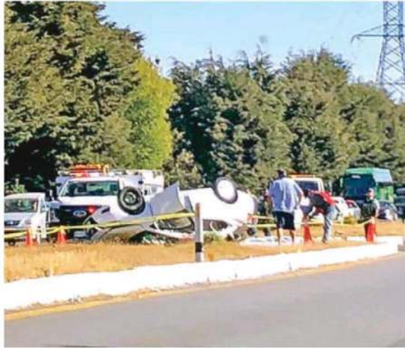
El copiloto fue rescatado de entre los fierros retorcidos del vehículo