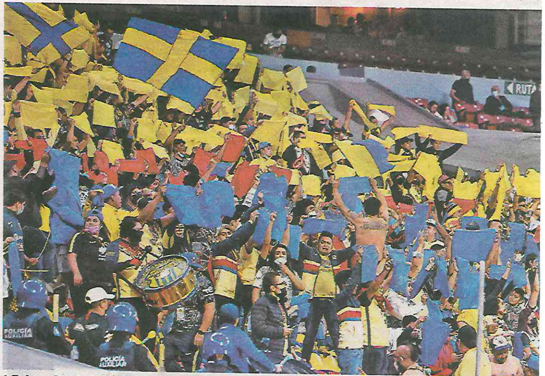
Aficionados de América, en un partido en el estadio Azteca.

Por eso mismo, en la semana se reunieron con las porras, a las que se les transmitió que el plan no es desaparecerlas, pero sí integrarlas a un mejor protocolo que cumpla con los estándares que planea la Liga Mx, aunado a que por ahora no se han vuelto inmiscuidas en problemas y