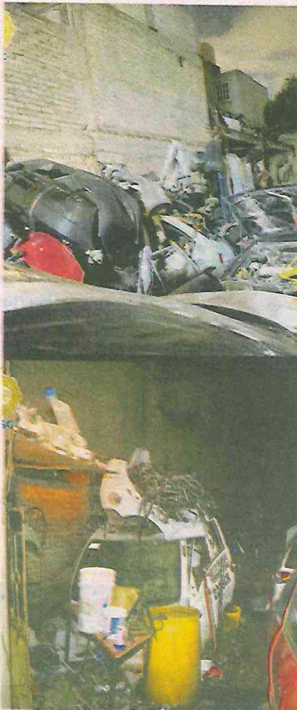
Catean dos domicilios con autopartes robadas en Iztapalapa

En un segundo punto, dentro de la misma demarcación, se realizó en la avenida Del Árbol y la calle Álamo, de la colonia Consejo Agrarista Mexicano, ahí