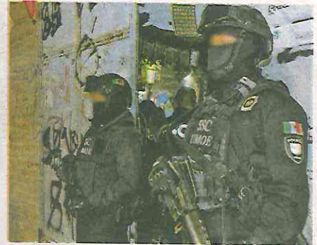
En cumplimiento de órdenes judiciales, participaron elementos de SSC y FGJCDMX

se encontraba aleta de cristal, que, al cortejar con la carpeta de investigación, tendría una denuncia de robo del día 13 de febrero del presente año y perteneciente a un vehículo de lujo.