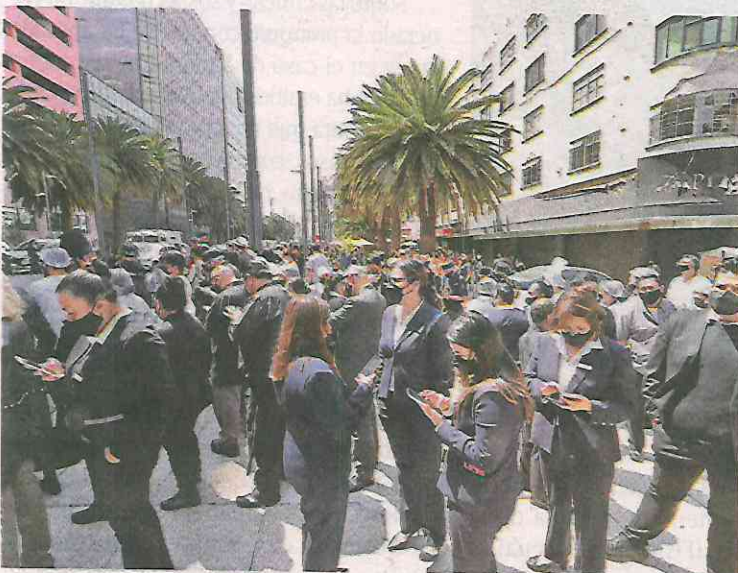
Tras sismo de 4.8 grados, fueron desalojados varios edificios, uno de ellos, junto al Monumento a la Revolución

El Tren Ligero indicó que se pone en marcha el protocolo de revisión de instalaciones. El Aeropuerto Internacional de la Ciudad de México (AICM) informa que, hasta el momento, las operaciones de aterrizajes y despegues se realizan con normalidad.