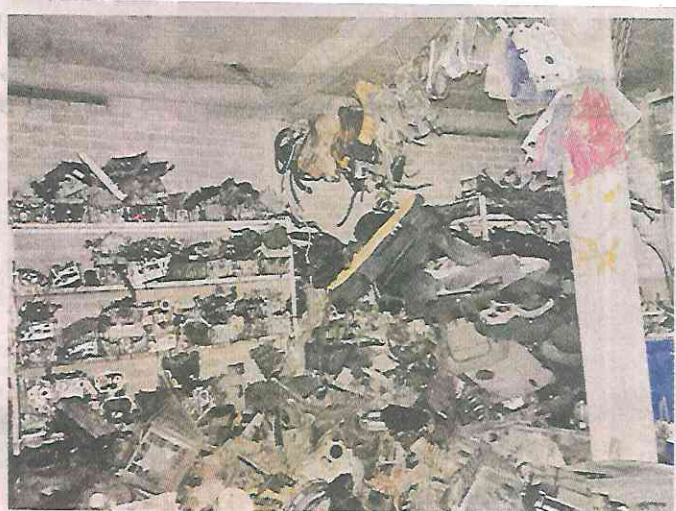
El primer cateo fue en el Pueblo Santa María Aztahuacan y el segundo en la Colonia Consejo Agrarista Mexicano.