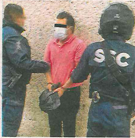
El detenido dijo pertenecer a grupo delincuencia integral integrado por extranjeros

Al notar la presencia de policías de la Secretaría de Seguridad Ciudadana de la