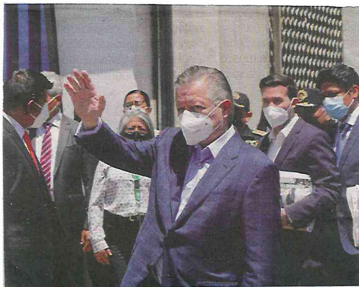
Arturo Zaldívar Lelo de Larrea, ministro presidente de la Suprema Corte de Justicia de la Nación.

“Y de ser viable, necesario y adecuado, propondré a los gobernadores de estos dos estados que podamos celebrar un convenio similar al que suscribí con la doctora Claudia Sheinbaum, jefa de Gobierno de la Ciudad de México, para que nuestros defensores puedan defender a las personas indígenas”, manifestó.