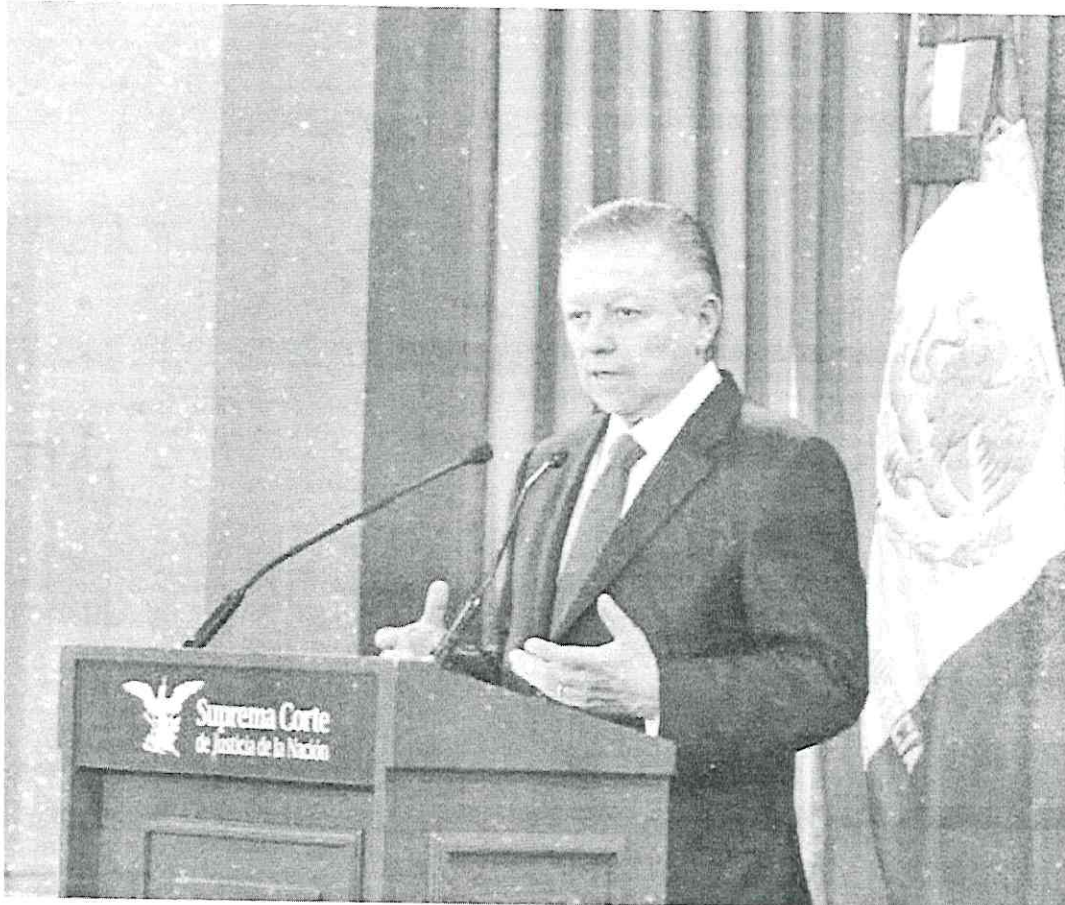
PROYECTO. El presidente de la Corte anunció estrategia en favor de mujeres e indígenas presas.