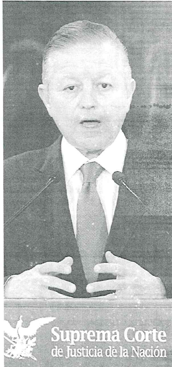
Luego de que la semana pasada visitara el penal de Santa Martha Acahula, el ministro informó que el IFDP asumirá la defensa de 200 internos

ARTURO ZALDÍVAR Presidente de la Suprema Corte El Instituto Federal de Defensoría Pública (IFDP) buscará la revisión de la prisión preventiva en los casos donde la persona lleva más de 2 años reclusa"