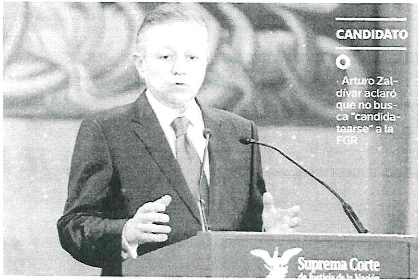
No fue a Santa Martha a "tomarse la foto"