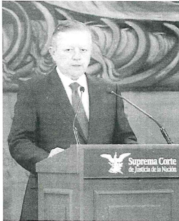
Arturo Zaldívar, presidente de la SCJN