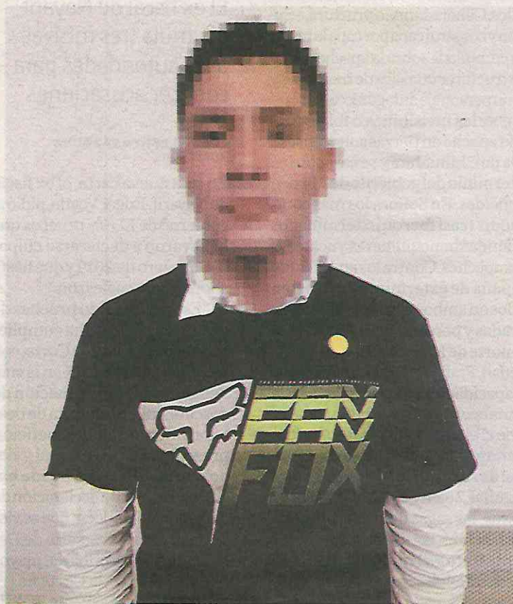
El joven fue llevado al Reclusorio Oriente.