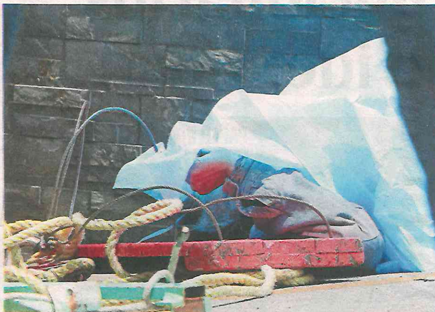
El trabajador de mantenimiento cayó de más de 10 metros de altura

Tras el accidente ocurrido aproximadamente a las 12:00 horas de este jueves, un grupo enfermeros que trabajan en un hospital de la zona y que pasaban por el rumbo, intentaron reanimarlo sin éxito.