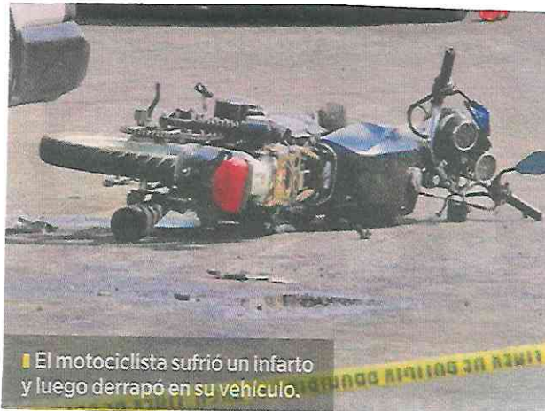
■ El motociclista sufrió un infarto y luego derrapó en su vehículo.

Esto hasta que arribaron los peritos de la Fiscalía de Justicia capitalina para llevar a cabo el levantamiento del cuerpo, el cual no fue reconocido en el lugar.