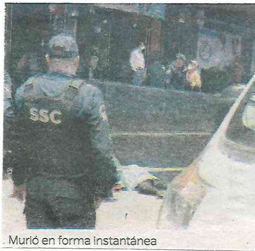
Murió en forma instantánea

La Fiscalía capitalina investiga si el hombre que perdió la vida laboraba con las medidas de seguridad que marcan los protocolos