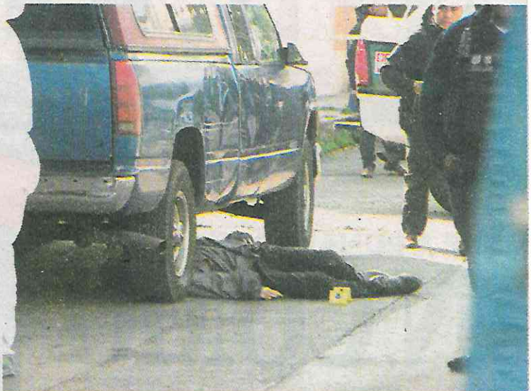
Quedó medio cuerpo metido bajo la camioneta

Todo indica que el hoy occiso fue atacado durante una riña