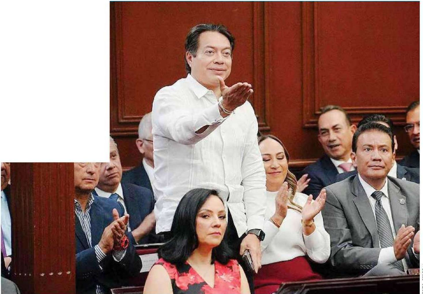
APOYO | • El dirigente nacional de Morena, Mario Delgado, previo a la emisión de la convocatoria, acudió al informe de Ramírez Bedolla.