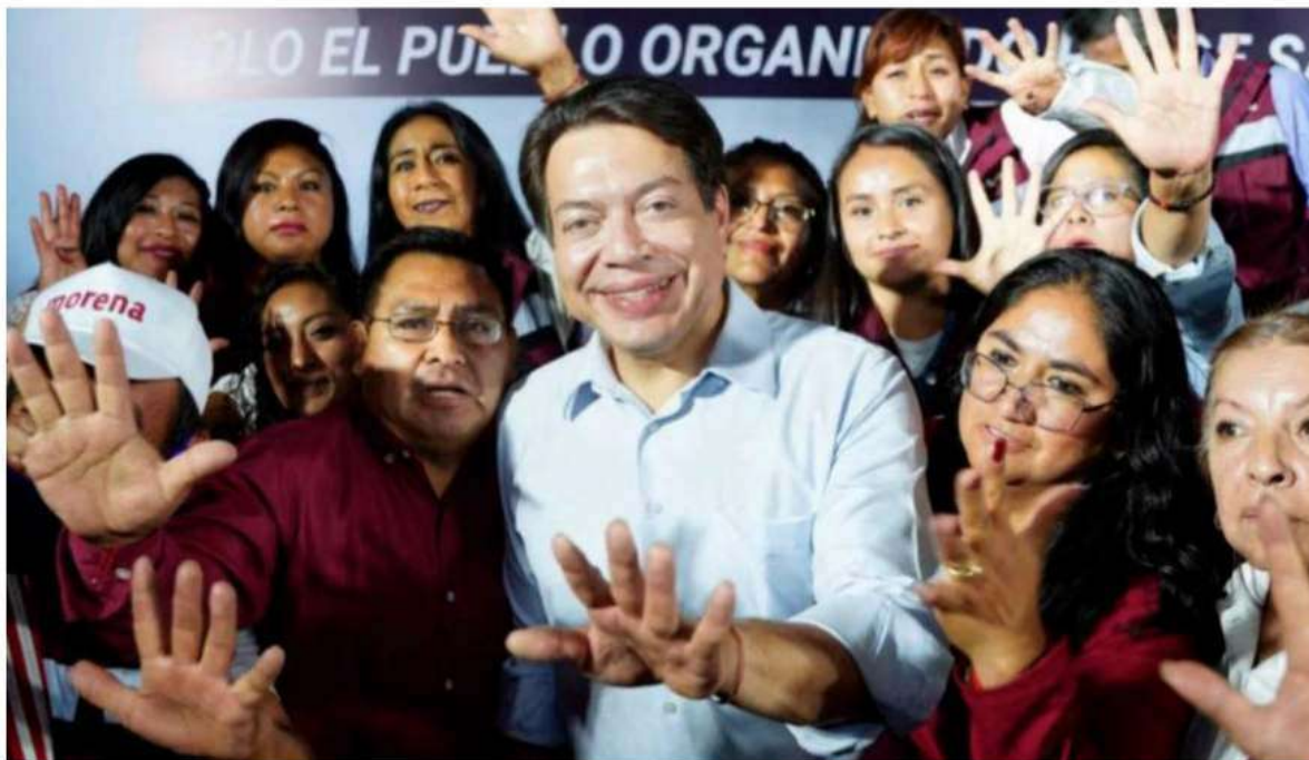
Mario Delgado, dirigente de Morena, dio a conocer vía Twitter la convocatoria.