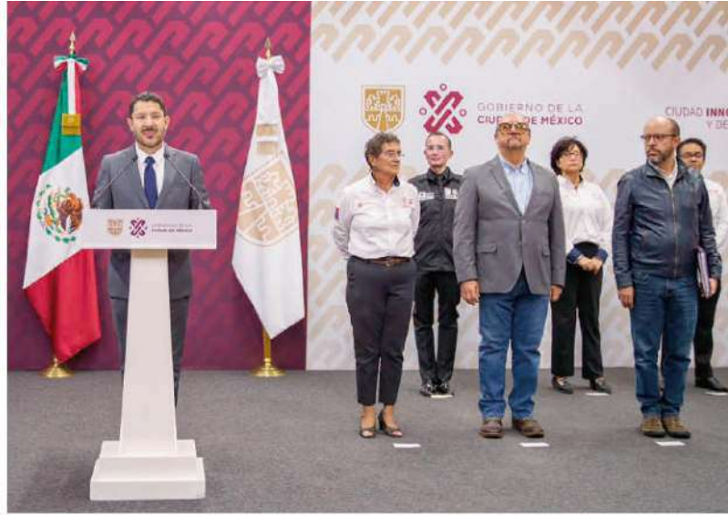
EL MANDATARIO capitalino, durante la conferencia de prensa que ofreció ayer.