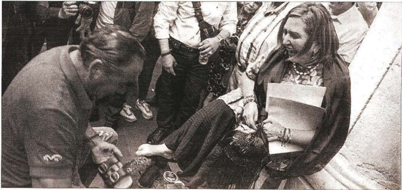
Los del partido gobernante siguen atacando a Xóchitl Gálvez y haciéndola crecer todavía más.