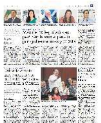
Destape. Mario Delgado, presidente nacional de Morena, ayer.