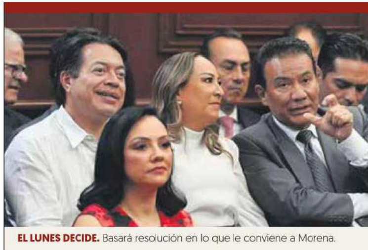
EL LUNES DECIDE. Basará resolución en lo que le conviene a Morena.