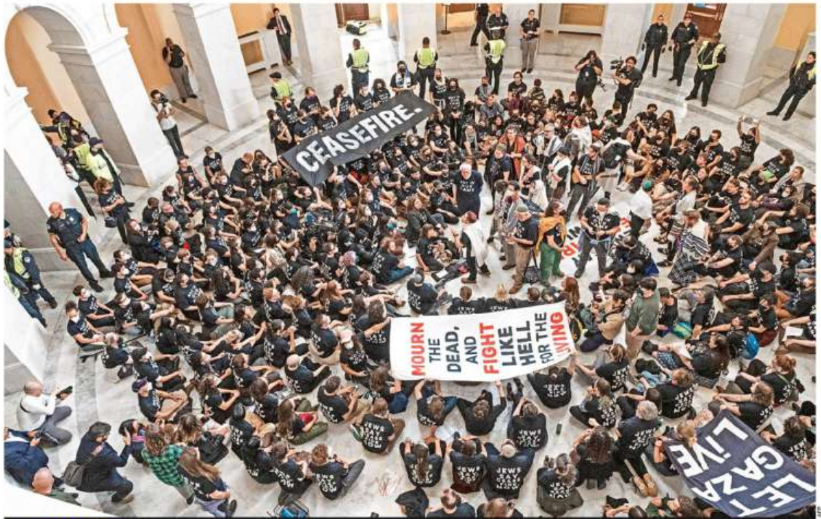
ASALTO PACÍFICO. Manifestantes judíos tomaron el Capitolio de EU en Washington para exigir el alto al fuego de Israel en Gaza, mientras Joe Biden se encontraba de visita en Tel Aviv, donde cambió su respaldo a la invasión terrestre por la entrada de ayuda humanitaria MUNDO P. 14