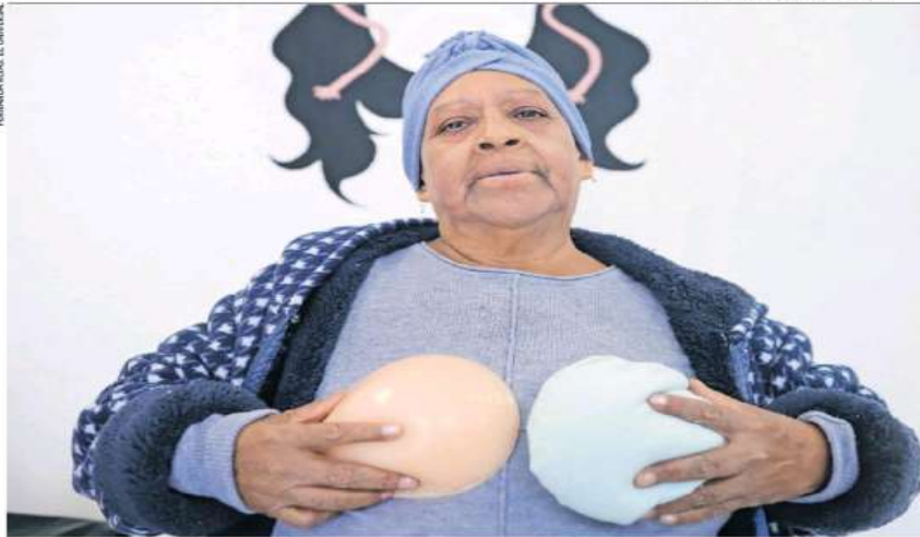
IMAGEN DEL DÍA DISEÑAN PRÓTESIS CON SEMILLAS