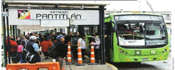
Los usuarios señalan que los traslados se han triplicado desde el cierre de la Línea 1 y que tienen que buscar otras formas de transportarse.

cremento fue Puebla, pues los usuarios del oriente llegaban por la 9.