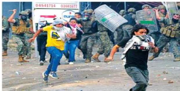
Soldados del ejército libanés se enfrentaron contra los manifestantes en Beirut.