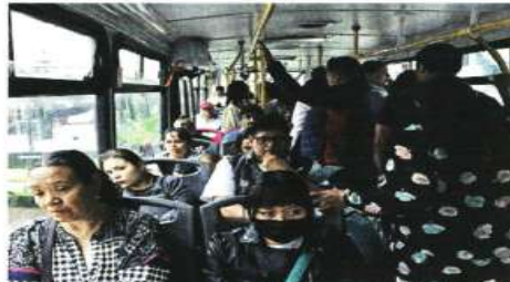
Las filas para abordar las unidades, en la estación Pantitlán del Metro, pueden tomar horas.

Sin embargo, el Jefe de Gobierno, Martí Batres, afirmó que el cierre se daría hasta reabrir la Línea 1. Pero, el 30 de septiembre, explicó que la reapertura iría hasta Isabel la Católica,