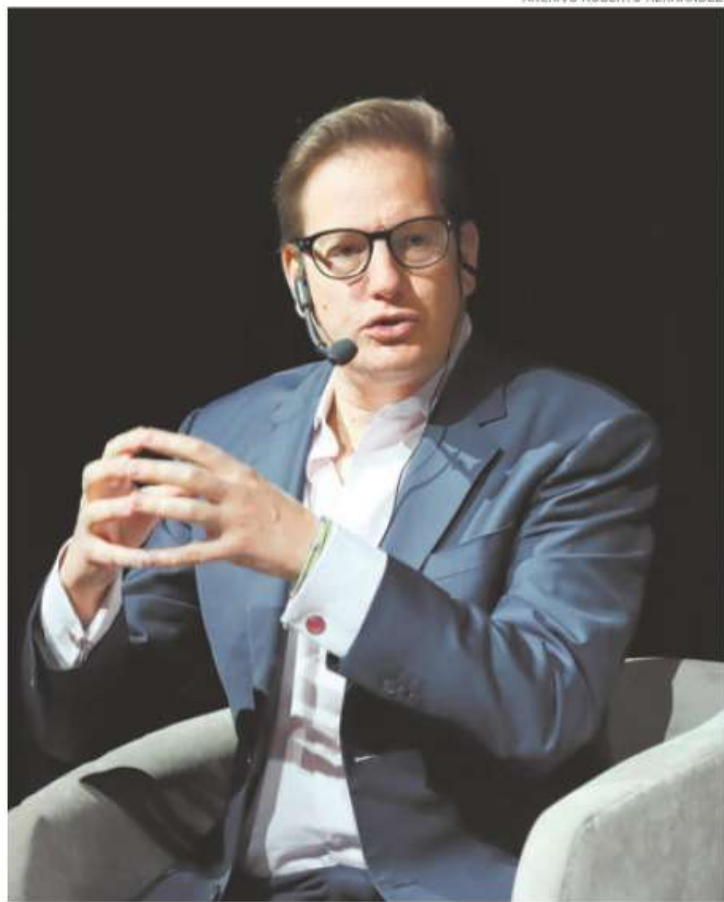
El diputado publicó el 9 de octubre un libro con propuestas para la CdMx

“Cuando llegue el momento de las campañas, ahí será cuando empiece a contrastar, contrastar a partir de las ideas, porque, pues al parecer, voy a tener que competir entre policías y ladrones, y ¿có-