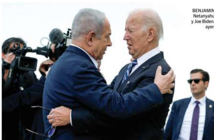
BENJAMIN Netanyahu y Joe Biden, ayer.

REITERA que no estará solo en lucha contra terroristas; gestiona que se puedan entregar apoyos y suministros a Gaza varados en Egipto. págs. 17 y 22