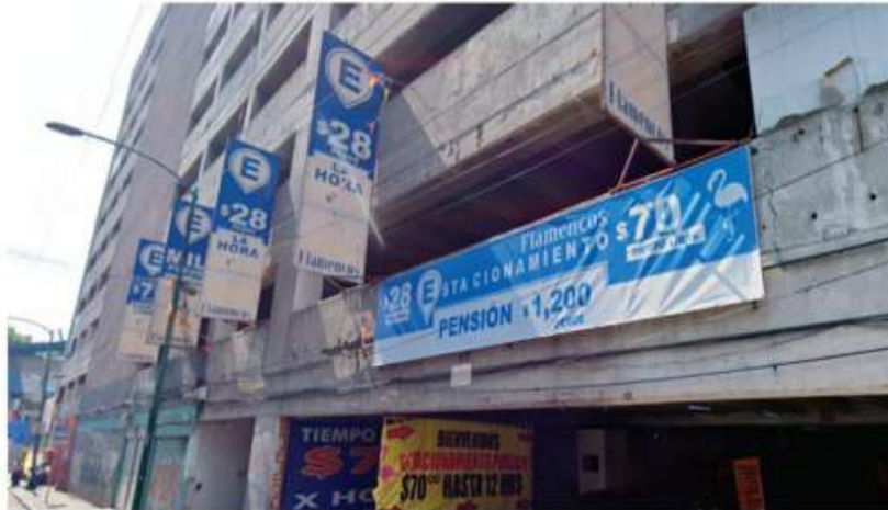
Estacionamiento cercano al Palacio Nacional.

Gerardo Mayoral metropoli@cronica.com.mx