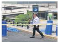
Los cuerpos de los dos hombres quedaron sobre el pavimento.

Los hombres “eran perseguidos previamente por sujetos armados”, quienes se dieron a la fuga, señalaron autoridades de Huixquilucan. La fiscalía indicó que no se sabe si fue un ataque directo o asalto. ●