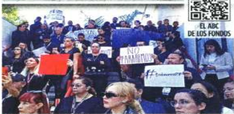
En su tercer día de protesta, los trabajadores del Poder Judicial acordaron suspender labores hasta el 24 de octubre.