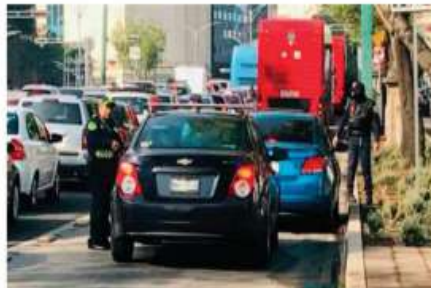
Infractores de tránsito enfrentarán multas por obstruir el servicio del Metrobús.

a lo largo de los corredores para levantar infracciones de aquellos vehículos que invadan el carril del Metrobús, porque invadir el carril del Metrobús es una sanción al reglamento de tránsito, además de que retrasas nuestro servicio, y expones tu seguridad y la de nues-