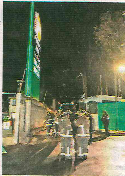
La noche del jueves , una pipa de gas LP se incendia en un predio pegado a una gasolinera

Despachadores de combustible , al temer que las llamas pudieran extenderse hacia las bombas de gasolina, solicitaron auxilio mediante una llamada al 911