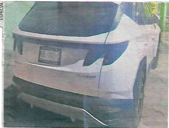
La víctima murió a bordo de esta camioneta blanca.