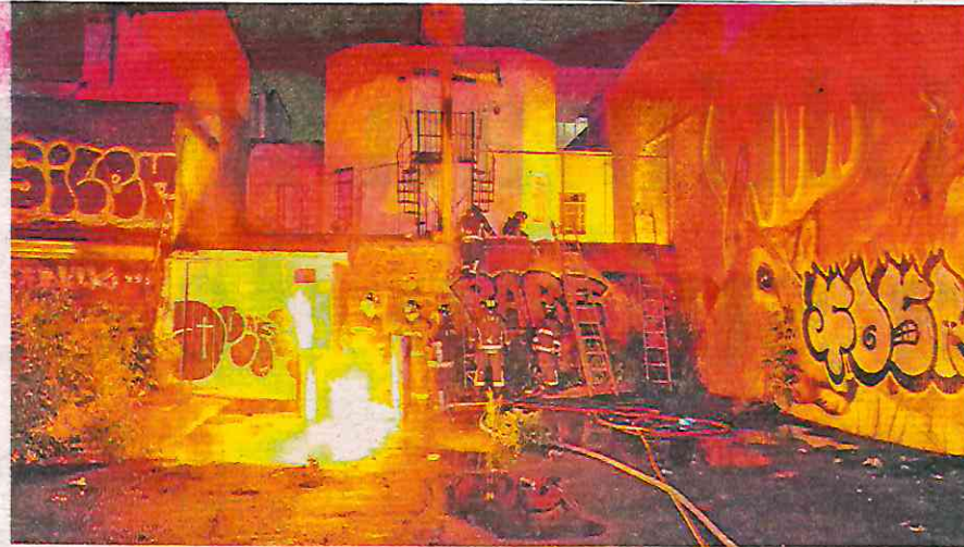
En la colonia Roma tres tanques de gas se incendian provocando alarma entre vecinos. Al lugar acudieron elementos de la policía capitalina, de Protección Civil y Bomberos; no se reportaron lesionados