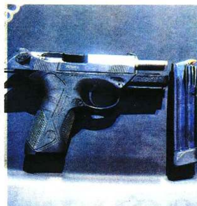
Detienen a hombre en operativo del Buen Fin, le fue encontrada una pistola con cargador abastecido con varios cartuchos útiles