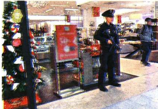
Operativo de vigilancia durante el Buen Fin 2023

A los usuarios se les sugiere establecer contraseñas sólidas que incluyan números, signos, letras mayúsculas y minúsculas, para evitar que sean descifradas con facilidad por ciberdelincuentes, así como ignorar mensajes vía SMS que hagan mención de un falso cargo. En dicho caso deberán comunicarse directamente con la institución bancaria correspondiente.