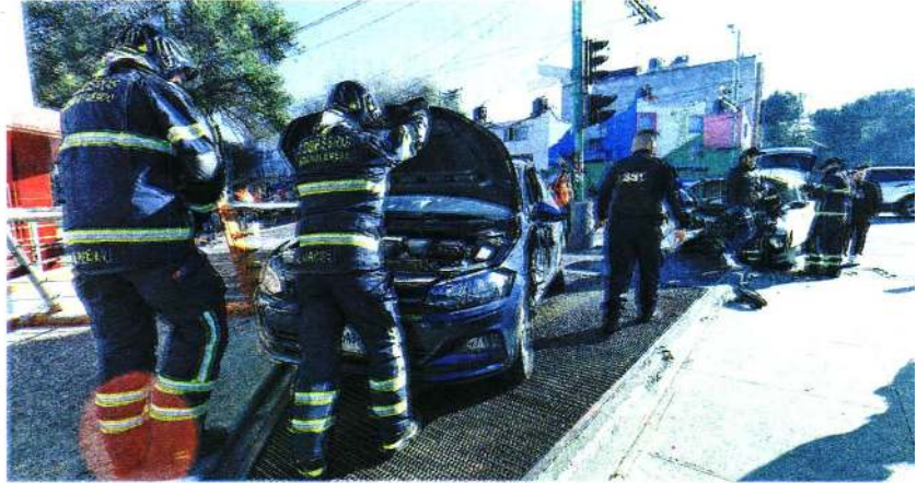
Fuerte choque en la colonia Doctores deja dos vehículos destrozados

Los paramédicos encargados de atender el reporte, determinaron que el conductor afectado, quien únicamente resultó con leves golpes, no ameritaba traslado hospitalario, por lo que se retiraron de inmediato.