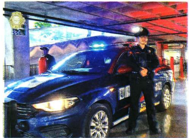
Desplegados 14 mil 867 policías capitalinos, principalmente en plazas y centros comerciales de las 16 alcaldías, en el marco del operativo del Buen Fin