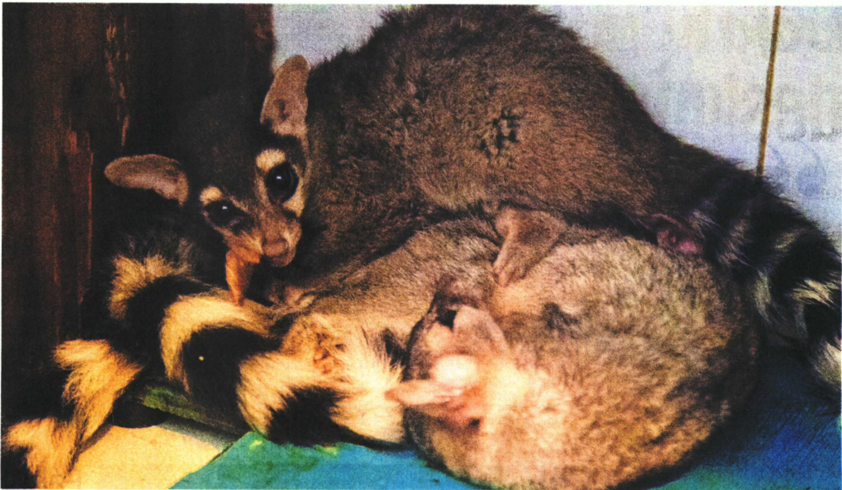
Con el cuerpo cubierto de un pelaje café, grandes ojos, orejas redondeadas y una larga cola anillada, suelen ser confundidos con mapaches, zorros, gatos e incluso lémures.