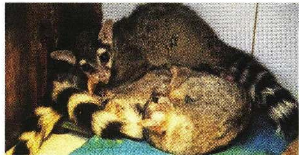
Pueden ser fácilmente confundidos con mapaches, zorros, gatos e, incluso, lémures.

De dos años para acá hemos estado recibiendo muchos más llamados de la ciudadanía por este tipo de especies (...) antes recibíamos dos o tres cacomixtles por semana y ahora son siete o 10".