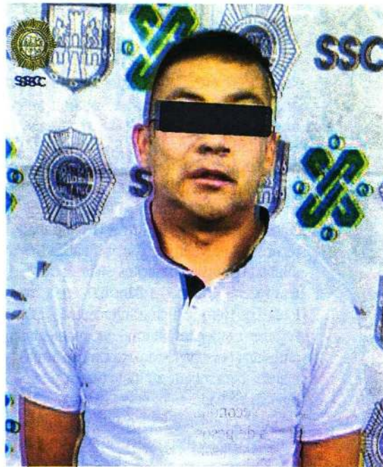
El detenido de 23 años de edad cuenta con ingreso al Sistema Penitenciario de la Cdmx por portación de arma de fuego de uso exclusivo del Ejército y Fuerza Aérea, en 2023