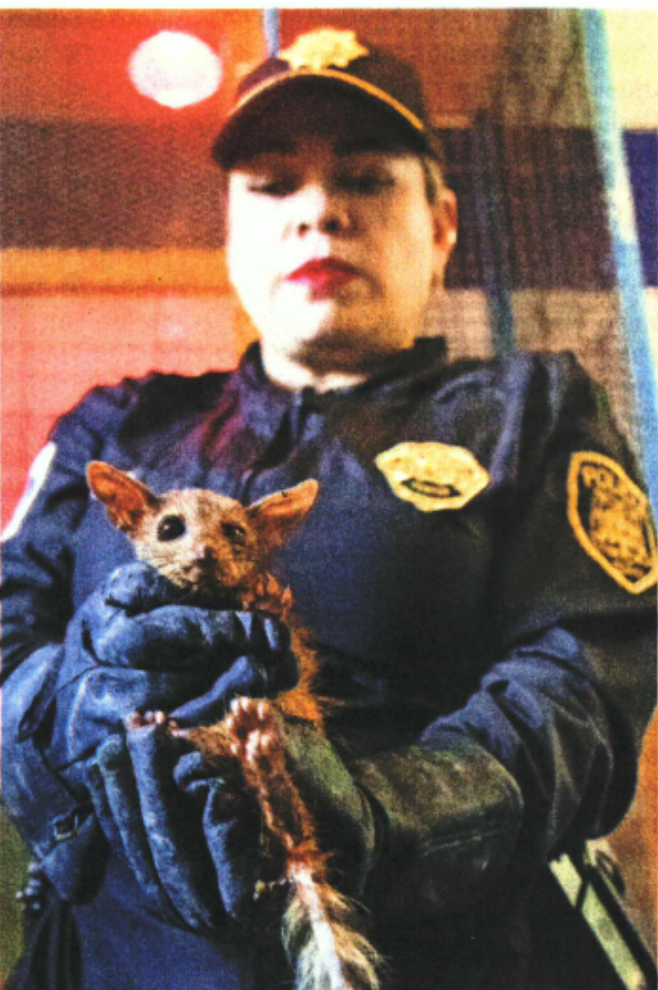
Cuando un cacomixtle es capturado se le da atención veterinaria y luego se libera en su hábitat natural.