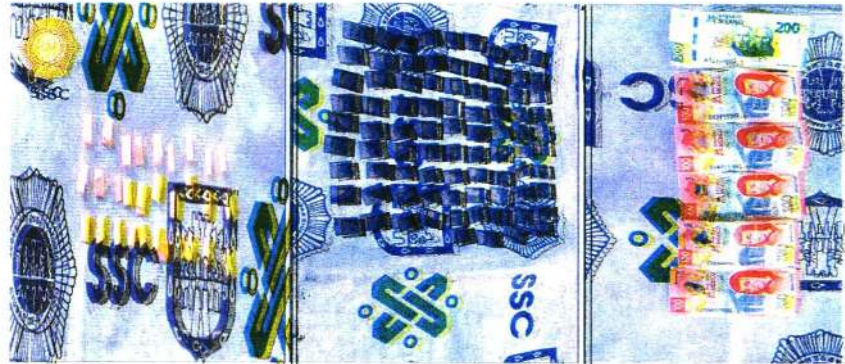
Hallan 85 bolsitas de plástico y 30 envoltorios de papel, que en su interior contenían una sustancia sólida similar a la cocaína y dinero en efectivo

La detención se llevó a cabo como resultado de los trabajos de investigación en la colonia Campamento 2 de Octubre