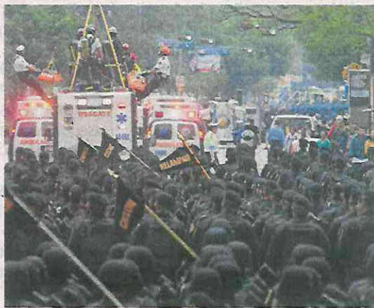
El desfile iniciará en el Monumento a la Revolución y concluirá en el Hemiciclo a Juárez.

Durante el paso del contingente se mostrarán vehículos y personal de más de 30 áreas especializadas que conforman a la policía, como la bancaria e industrial, la auxiliar, el grupo Ateneas, las coordinaciones generales de la Subsecretaría de Operación Policial, de tránsito, con el grupo de acrobacia, la policía montada y el ERUM, entre otras. ●