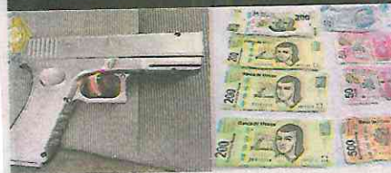
El imputado de 37 años acababa de asaltar a un repartidor en Icaldía Iztapalapa