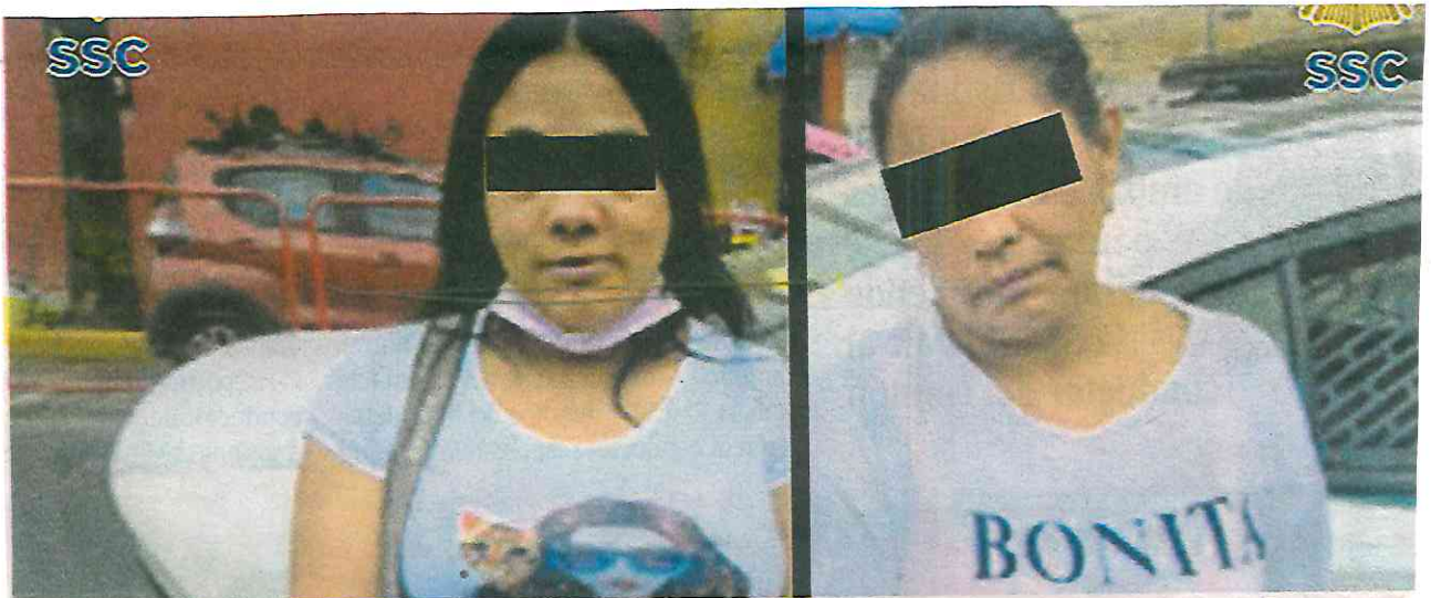
Los uniformados dieron alcance a las posibles responsables, de 47 y 27 años de edad