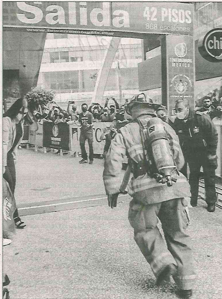
▲ Para medir habilidades, un centenar de bomberos subieron por las escaleras los 42 pisos del edificio, con todo y equipo de trabajo, los ganadores hicieron el menor tiempo.