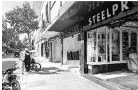
Préstamos ponen en peligro vidas y negocios

Raúl los conoció por otro comerciante que se dedica a trabajar con ellos para convencer a los locatarios de pedirle a los colombianos y no al banco