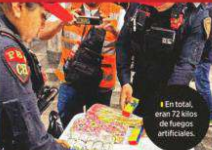
En total, eran 72 kilos de fuegos artificiales.