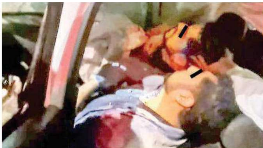
Hasta el momento, se desconoce la identidad de la víctima mortal, cuyo cadáver fue trasladado al anfiteatro