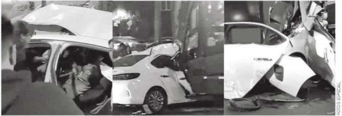
Se toparon de frente con la unidad de transporte masivo