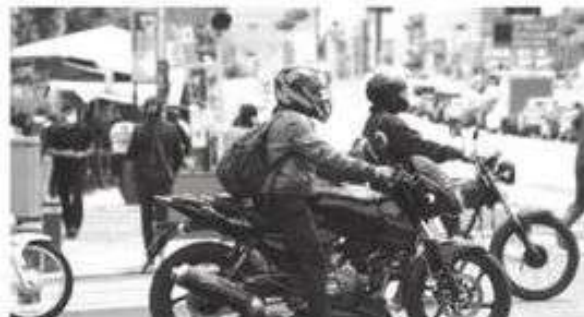
Aumenta parque vehicular de motos

Es esencial que motociclistas estén informados sobre sus derechos