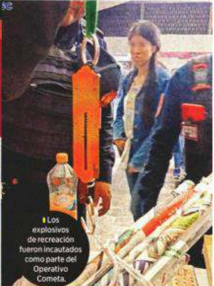
Los explosivos de recreación fueron incautados como parte del Operativo Cometa.