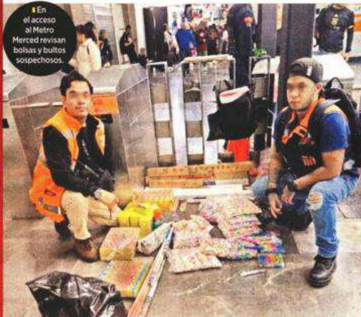
En el acceso al Metro Merced revisan bolsas y bultos sospechosos.