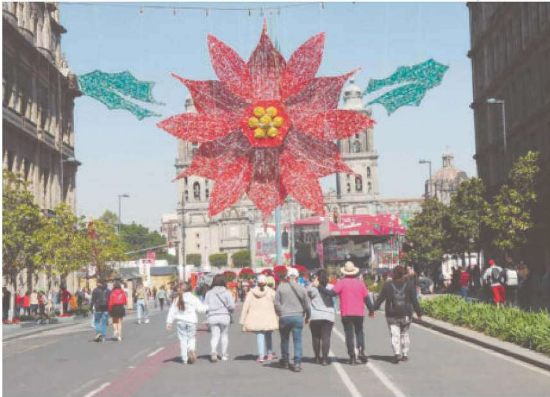
Madero , la Alameda y la Plaza de la Constitución son las calles con más casos