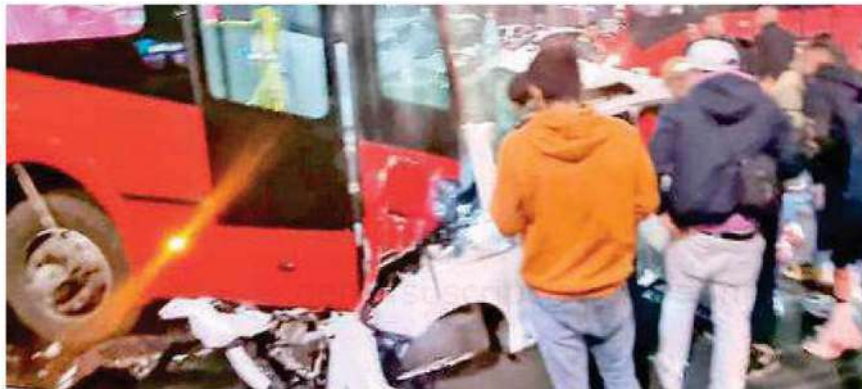
Las imágenes difundidas por los testigos, dejaron en evidencia que el coche fue el que sufrió mayores daños