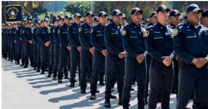
Los oficiales serán desplegados en las 16 alcaldías.