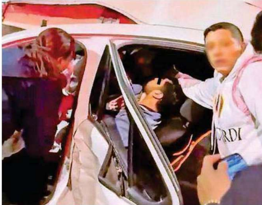
Bomberos llegaron hasta el lugar del accidente para colaborar en las maniobras a fin de liberar el vehículo blanco del Metrobús