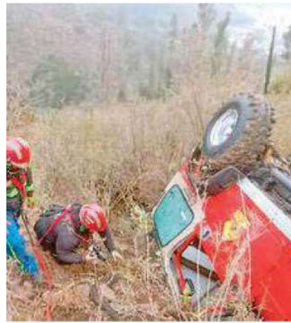
Vehículo volcado en la zona ecológica Binguineros, con saldo de un niño muerto y mujer herida

Posteriormente, se solicitaron los servicios periciales correspondientes y se dio parte al agente del Ministerio Público para las indagatorias subsecuentes del caso.