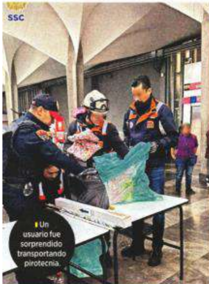
Un usuario fue sorprendido transportando pirotecnia.