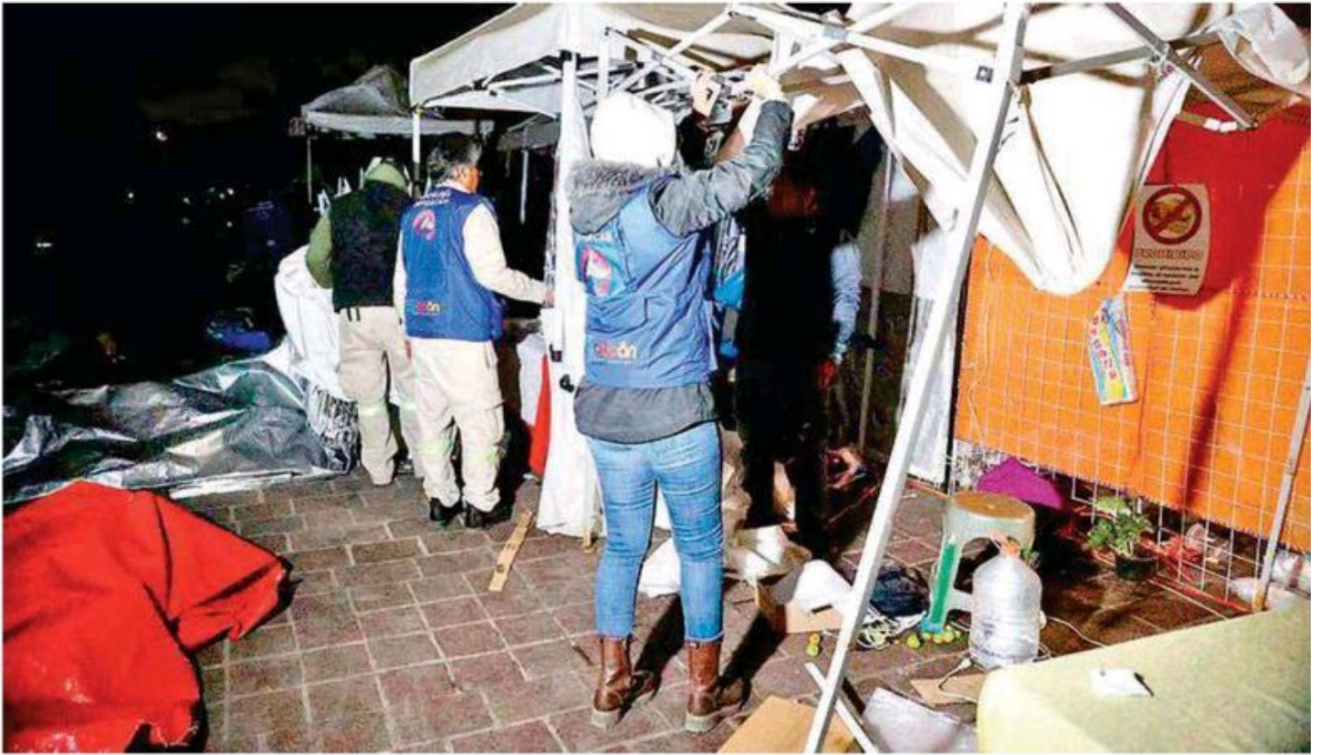
La alcaldía señaló que actuó de forma legal al haberse vencido el plazo de 24 horas que se acordó en una mesa de diálogo