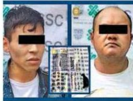
Ambos detenidos cuentan con ingresos al Sistema Penitenciario

Además, el detenido de 27 años de edad tiene un ingreso en el año 2017 por el delito de Robo agravado.