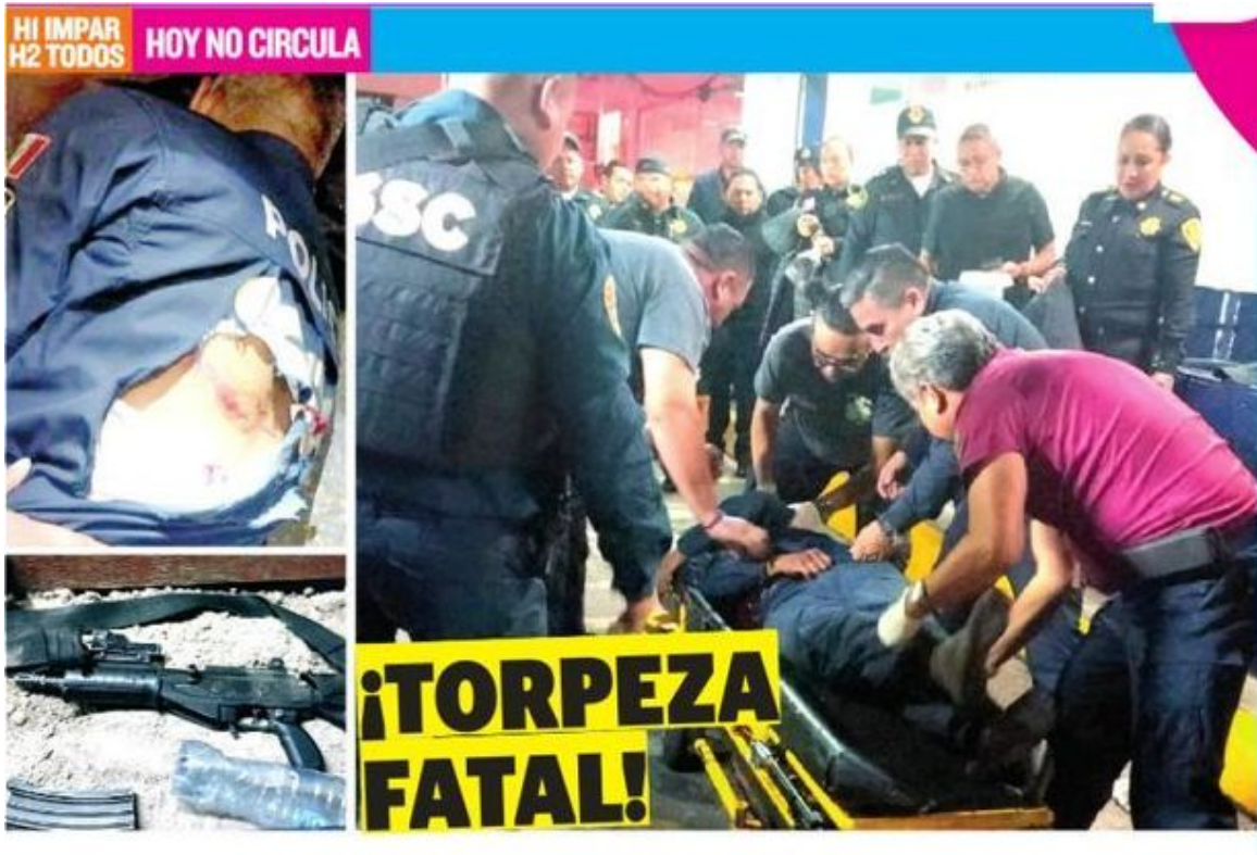
Sus compañeros trataron de reanimarlo, pero la herida fue mortal