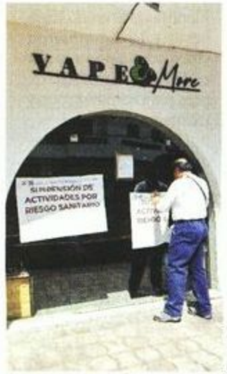
La Sedesa ha clausurado 37 establecimientos.

“Desde 2019 a la fecha, en las 16 alcaldías de la Capital se han fortalecido las actividades de vigilancia y fomento sanitario, por lo que se llevan a cabo verificaciones sanitarias, aseguramiento de productos, suspensión de actividades, capacitaciones y asesorías a grupos vulnerables”, informó la Sedesa.