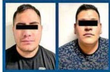
Aprehenden a presuntos ladrones de relojes de alta gama

Tras dicha acción, les hallaron una réplica de arma de fuego corta, dos teléfonos celulares y 478 dosis de un polvo blanco con las características de la cocaína, motivo por el cual los hombres, ambos de 29 años de edad, fueron detenidos, informados de sus derechos de ley y puestos a disposición del agente del Ministerio Público quien definirá su situación jurídica. Cabe señalar que, de acuerdo con información obtenida, el vehículo asegurado y los detenidos, están posiblemente relacionados con el robo de un reloj de alta gama a un usuario del AICM, ocurrido el pasado 04 de diciembre en el Viaducto Miguel Alemán, en la colonia Buenos Aires, de la alcaldía Cuauhtémoc.