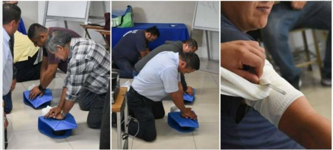
Abordan técnicas como la maniobra de Heimlich, la reanimación cardiopulmonar (RCP), el control de hemorragias, fracturas, entre otras.