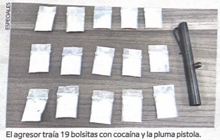
El agresor traía 19 bolsitas con cocaína y la pluma pistola.