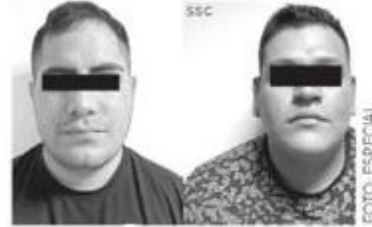
Ya debían varias

Tras dicha acción, les hallaron una réplica de arma de fuego corta, dos teléfonos celulares y 478 dosis de cocaína, motivo por el cual los hombres, ambos de 29 años de edad, fueron detenidos y puestos a disposición del agente del MP quien definirá su situación jurídica.