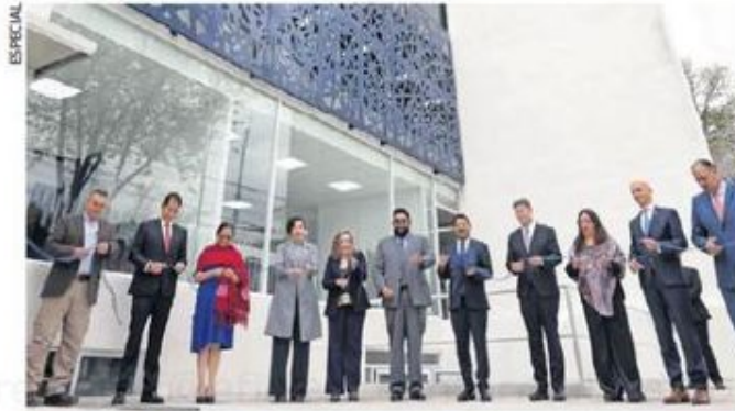
El nuevo edificio ayudará a dignificar el trabajo de quienes laboraban en otras condiciones en la FGJ, dijeron autoridades.

se invirtieron en el edificio ubicado en la colonia Doctores.