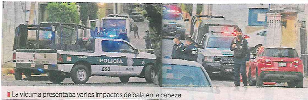
■ La víctima presentaba varios impactos de bala en la cabeza.

Antes de esto, ordenaron a los policías para que cruzaran sus patrullas a la mitad de la calle y así, los pocos testigos no lograran ver las diligencias que realizaban.