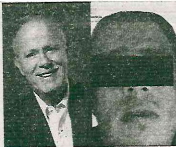
Vas 12 procesados