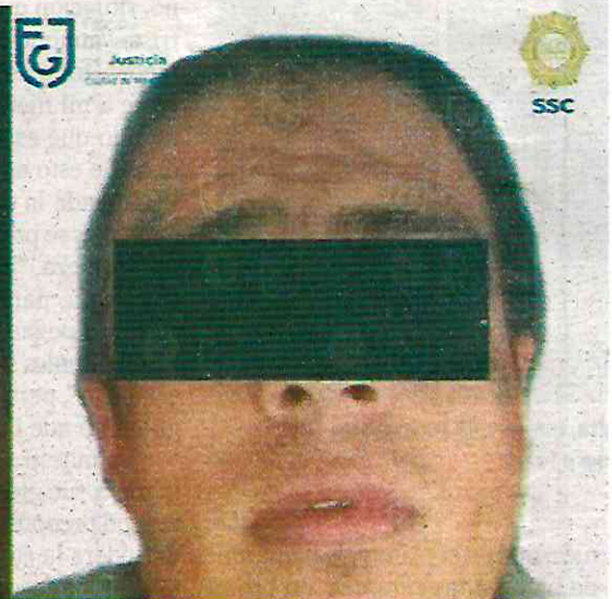
El atentado contra el comunicador fue la noche del 15 de diciembre a unos metros de su casa.

Junnuen "N", Aniceto "N" y Erick "N" y Sergio "N".