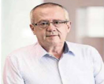
MIGUEL EL UNIVERSAL

Carlos Urzúa, el primer secretario de Hacienda de este sexenio y colaborador de este diario, falleció ayer. | A2 |