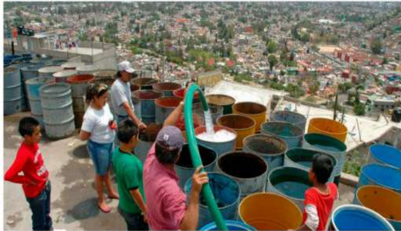
Enfrentamos una crisis de disponibilidad, accesibilidad y calidad del agua, denuncian los afectados.

De acuerdo con Meteored, la situación se agrava con la llegada de los meses más secos del año, marzo y abril. Se prevé que las presas del Cutzamala alcancen su nivel mínimo en junio, según la Comisión Nacional del Agua (Conagua). En este escenario, el caudal de este sistema se reducirá significativamente, afectando a co-