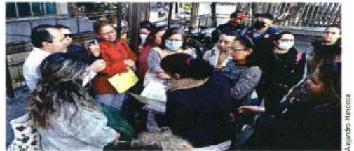
Los vecinos pidieron inspecciones detalladas en sus casas.

"Nos dieron información después de los sismos del 12 y 14 de diciembre de que, al menos, son 30 inmuebles los que se encuentran con riesgo alto y medio y que algunos de ellos tuvimos que ser desalojados", dijo Jimena, quien dejó su vivienda.