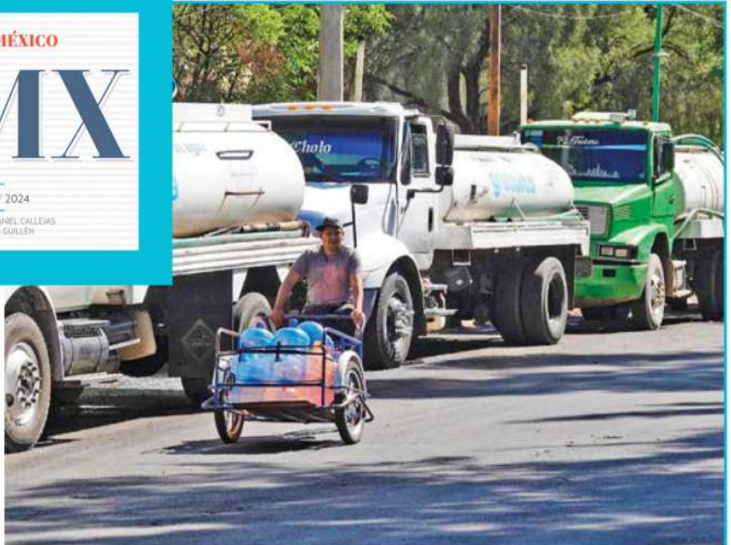
• OBJETIVOS. Los proyectos buscan eficientar los sistemas actuales de entrega de líquido para la población, por todas las vías.