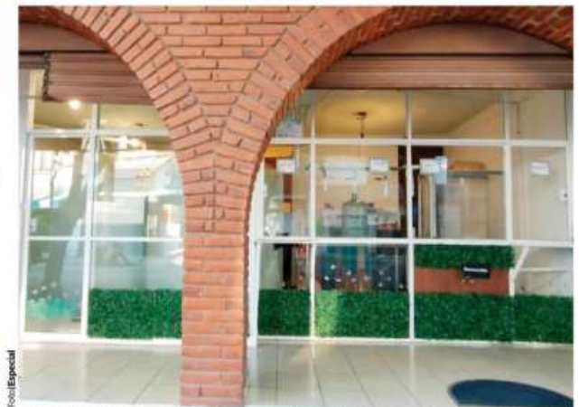
ESTA PURIFICADORA ubicada en la colonia Ampliación Providencia, en Gustavo A. Madero, seurtió de agua ayer, pese a los precios inflados de las pipas.

La dueña del pequeño establecimiento expresó que se siente preocupada, pues en caso de que la crisis hídrica se agudice tendrá que pensar en otro tra-