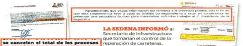
se cancelen el total de los procesos

Por su parte, el director de Conservación de Carreteras, Guillermo Hernández, informó el pasado 6 de febre-