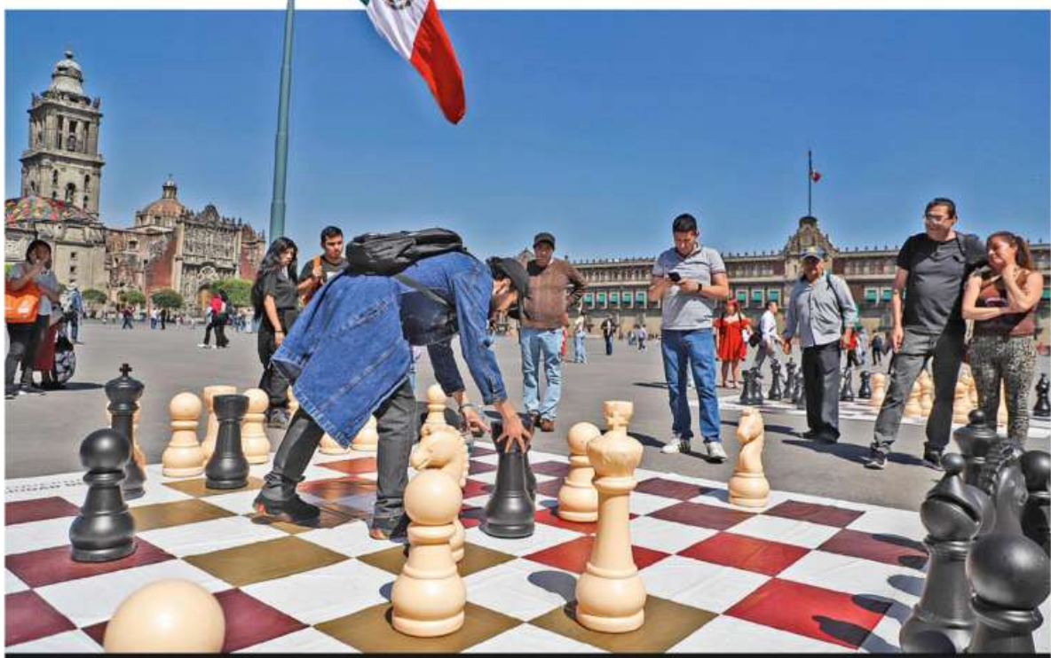
DEMOCRACIA Y ESTRATEGIA. Bajo una ondeante bandera que estuvo ausente el día de la marcha, los ciudadanos volvieron a apropiarse ayer del Zócalo capitalino, pero ahora lúdicamente para jugar ajedrez, actividad disponible desde que es peatonal. CDMX P.8