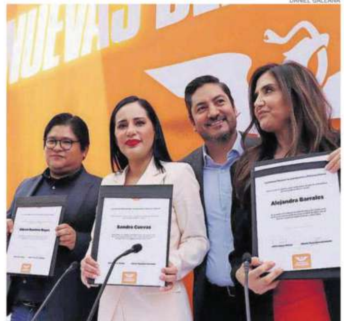
Los tres nuevos integrantes de Movimiento Ciudadano.

Durante el registro, el líder del partido, senador Dante Delgado expresó que se sentía orgulloso de que los hoy candidatos