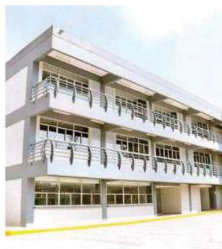
El Pase Automático, forma parte de las acciones para garantizar la educación pública