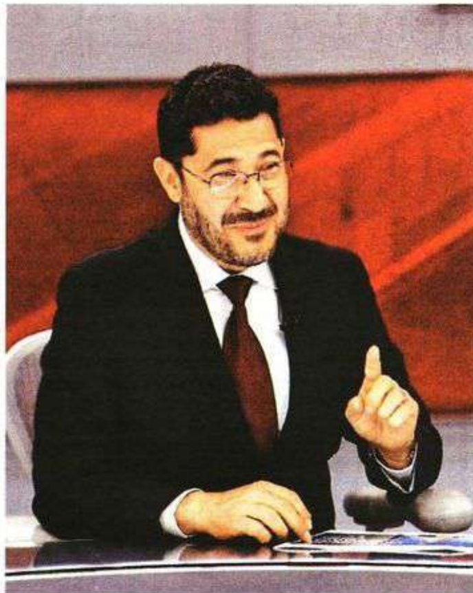
El morenista en su visita al estudio de CdMx.

—Muy poco, el grueso de las detenciones de las remisiones a Ministerio Público o juzgado cívico las hace la policía capitalina, la Secretaría de Seguridad Ciudadana, que como tal hace 92 por ciento de las remisiones, y las alcaldías como 8 por ciento. Digo, se agradece, pero en realidad es una parte pequeña.