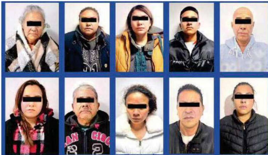
Presuntos integrantes del grupo criminal detenidos durante seis cateos en Tláhuac, Xochimilco e Iztacalco, aseguran todo lo hallado