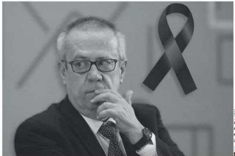
El exfuncionario fue miembro del actual equipo de Xóchitl Gálvez.

"Con profundo pesar, la familia Urzúa Valverde comunica que el día de hoy, lunes 19 de febrero del 2024 al medio día falleció el Dr. Carlos Manuel Urzúa Macías, ejemplar padre y esposo y destacado académico y economista mexicano. El Dr. Urzúa deja una huella significativa en nuestra familia, amigos y en el ámbito de las finanzas y la economía", escribió. ■