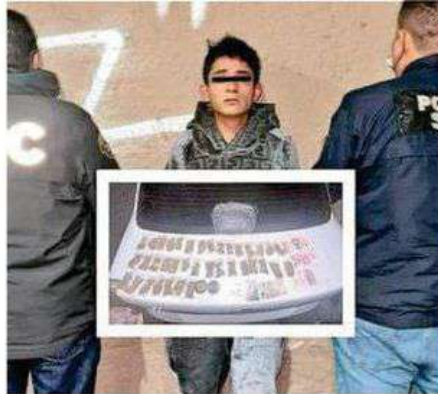
A la hora de su aprehensión se le aseguraron 37 bolsitas transparentes con vegetal verde con las características propias de la marihuana

A la hora de su aprehensión se le aseguraron 37 bolsitas transparentes que contenían vegetal verde con las características propias de la marihuana, un molino metálico y dinero en efectivo, producto de las ventas de droga entre alumnos de ese centro educativo