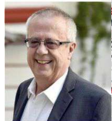
EL EXFUNCIONARIO Carlos Manuel Urzúa, en imagen de archivo.

Precandidata presidencial de Morena, PT y PVEM