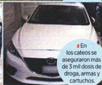
■ En los cateos se aseguraron más de 3 mil dosis de droga, armas y cartuchos.