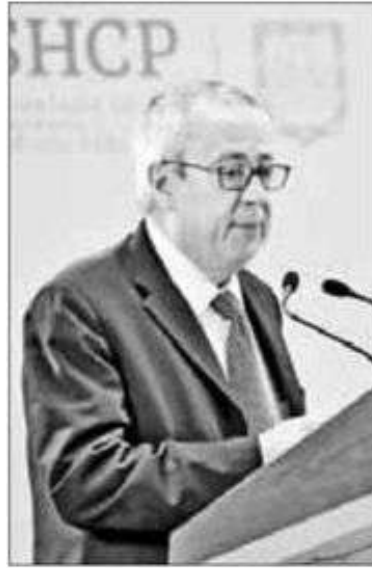
▲ El académico estuvo al frente de la dependencia durante siete meses, al empezar el actual gobierno.