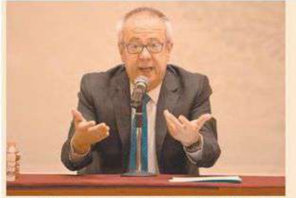
Carlos Manuel Urzúa Macías fue el primer secretario de Hacienda de la actual administración.

Diversos personajes de la política expresaron su sentir ante la partida de quien sería uno de los más duros críticos de la Cuarta Transformación.