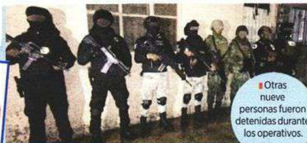
■ Otras nueve personas fueron detenidas durante los operativos.