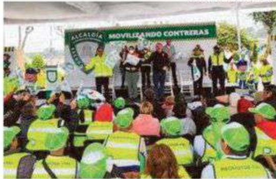
Estos promotores viales vestirán de verde