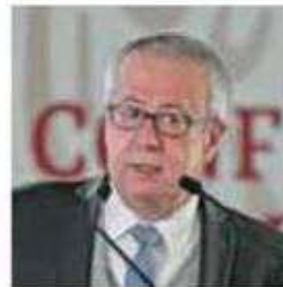
Funcionario. Urzúa se distanció de AMLO.

Familiares, políticos e instituciones expresaron su pesar por el fallecimiento del economista, entre ellos la candidata Xóchitl Gálvez, quien lo había incorporado a su equipo recientemente.