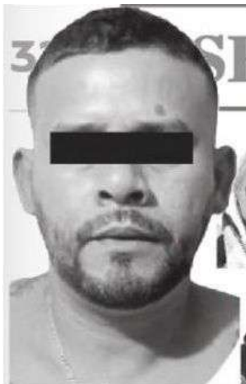
El Picoro cayó con casi toda su familia

Los sujetos se dedicaban al despojo de inmuebles, venta de narcóticos, extorsión y homicidio, entre otras actividades ilícitas en diferentes alcaldías de la CDMX.