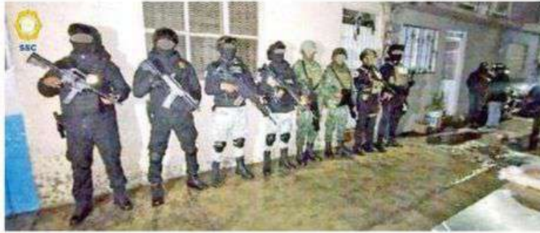
Despliegue operativo para atrapar al presunto líder del Cártel de Tláhuac