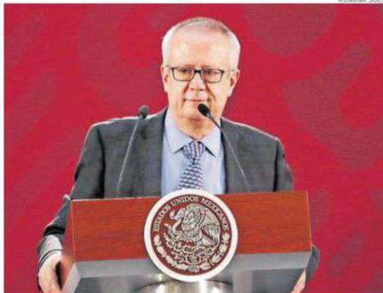
Su deceso fue en su casa.