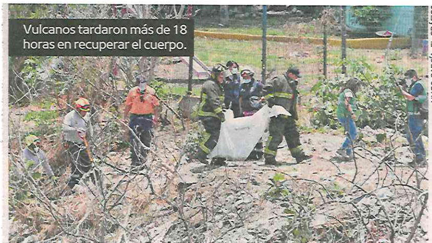
Vulcanos tardaron más de 18 horas en recuperar el cuerpo.