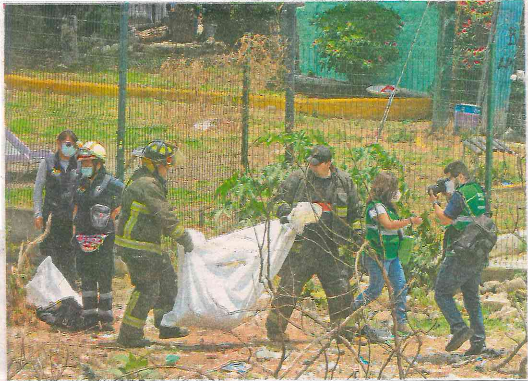
Trabajos El personal del Semefo local que rescataron a la víctima