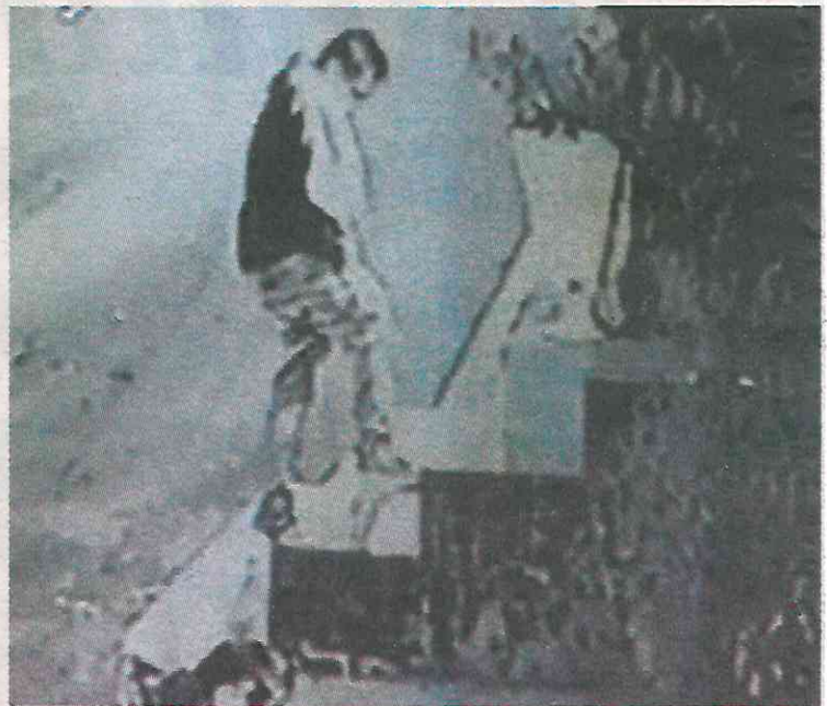
• Captan infraganti a los pillos

Hasta el momento de cerrar esta edición, no se reportan detenidos por este hecho.