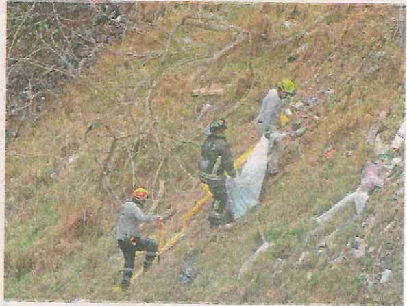
Ascendieron con el cadáver del sujeto desde el fondo del terreno

Vulcanos aseguraron el cuerpo y lo colocaron en