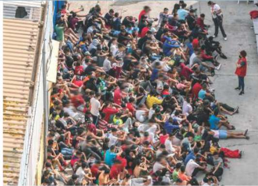
Crisis por niños migrantes solos en España

RECIBEN a 200 menores marroquíes (foto), alcalde de Ceuta pide a Marruecos frenar ola; ministerio del interior registra 5 mil devoluciones. pág. 19