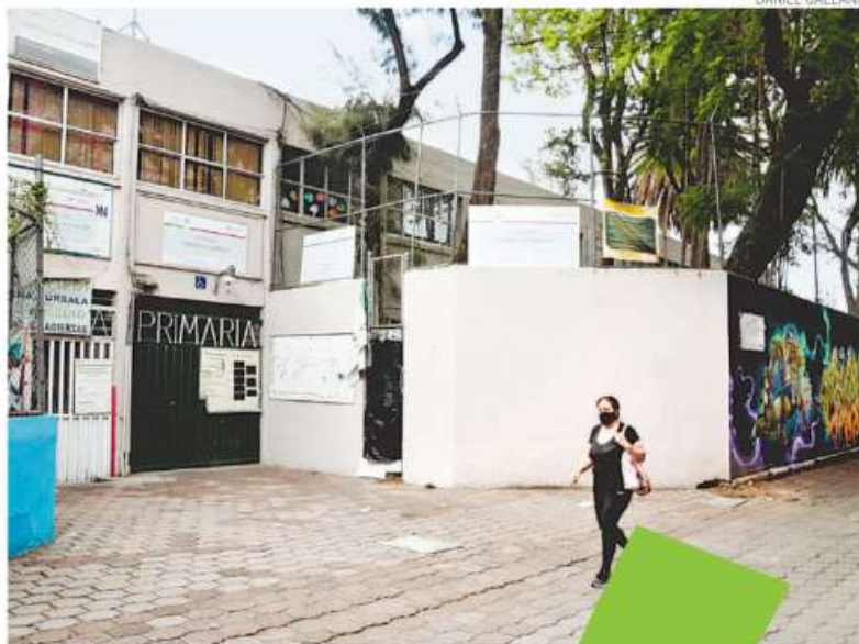
Comenzará de manera voluntaria y escalonada

COMO adelantó este diario, las escuelas tendrán un esquema alterno de asistencia por grupos y apoyo socioemocional