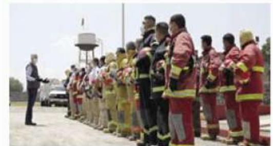
TECÁMAC, Edomex.- Alfredo Del Mazo. Agradecer el trabajo y heroísmo de los cuerpos de rescate.

El CICATEC brinda capacitación a brigadas, cuadrillas y voluntarios en los 125 municipios mexicanos, así como a otras entidades del país y a empresas privadas, mediante cursos teóricos y prácticos, en rubros como la preparación psicológica de los brigadistas, el tratamiento de personas lastimadas y el manejo de situaciones en lugares de acceso complejo, como espacios cerrados, estructuras colapsadas y sitios acuáticos o inundados.