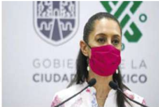
Claudia Sheinbaum. Regreso a clases voluntario, ordenado, escalonado y seguro.

El funcionario federal sostuvo que el regreso a clases presencial para concluir el ciclo escolar 2020-2021 permitirá un reencuentro