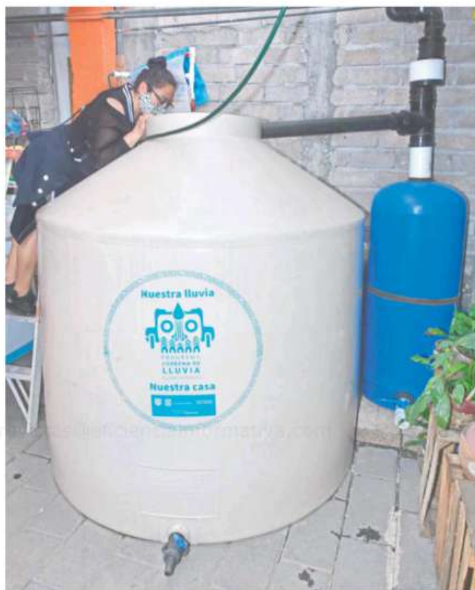
El programa de captación de agua de lluvia es una medida que debe promoverse en todo el país

De ahí que insistiera Chavira de la Rosa de que es necesario informar de la situación y alertar de las consecuencias, así como generar motivación para que la po-