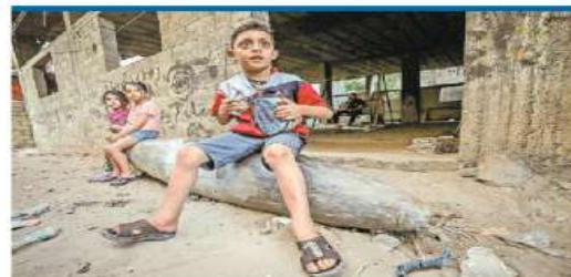
Niños palestinos se sientan en una bomba sin explotar lanzada por aviones de combate israelíes sobre la Ciudad de Gaza.