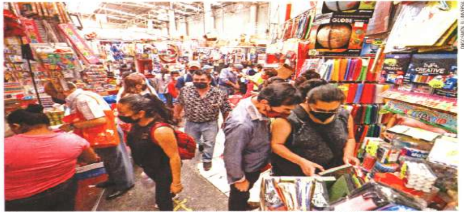
Ante el anuncio sobre el regreso a las clases presenciales, los comerciantes de útiles escolares en la Plaza Mesones, en el Centro Histórico, esperan que aumenten sus ventas. Poco a poco se observa más clientela.