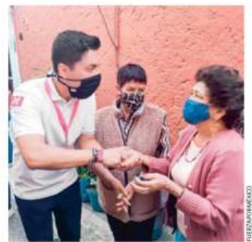
PROPUESTAS. El aspirante dijo que apoyará a los negocios y facilitará trámites administrativos.