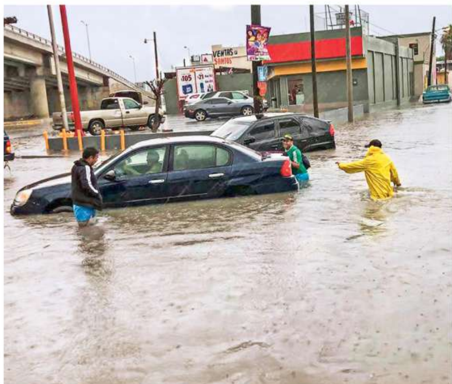
DILUVIO EN EL NORESTE. La tormenta que azotó ayer al amanecer a Reynosa, Tamaulipas, dejó severas inundaciones, autos bajo el agua, daños a inmuebles y a varias colonias sin luz ESTADOS P. 12

Miguel Ángel Osorio Chong se ha mostrado más activo en redes en apoyo a sus candidatos, más que en los días de sesión. Dante Delgado ha visitado varios estados como Nayarit y destacan sus apariciones y posicionamientos en defensa del candidato de MC al gobierno de Nuevo León. Damián Zepeda y Antonio Martín del Campo no han dejado de aparecer en actos proselitistas, al igual que Ricardo Monreal, entre otros MÉXICO P.3