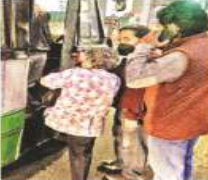
Hay quienes tardan hasta 6 horas en trayectos.