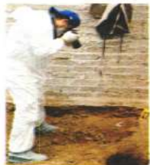
Peritos hallaron más huesos, ropa y artículos de mujer.