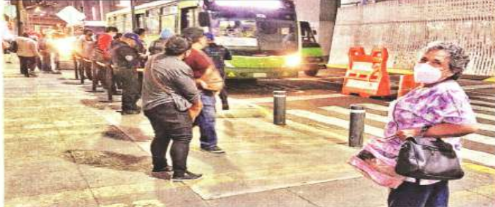
ETERNIDAD. Los usuarios deben esperar hasta 30 minutos para poder abordar.