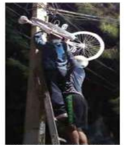
en Santiago Tulyehualco, se colocó una bici blanca que representa la muerte de un ciclista.

De no contar con ella podría ser causa de revocación de concesión. Este servicio no será solo para cuando haya incidentes, sino que se tendrá un servicio automatizado de revisión.