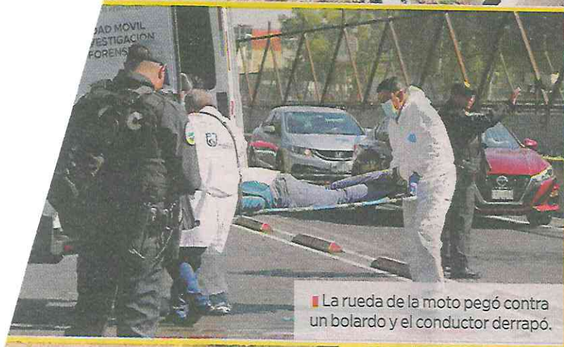
La rueda de la moto pegó contra un bolardo y el conductor derrapó.