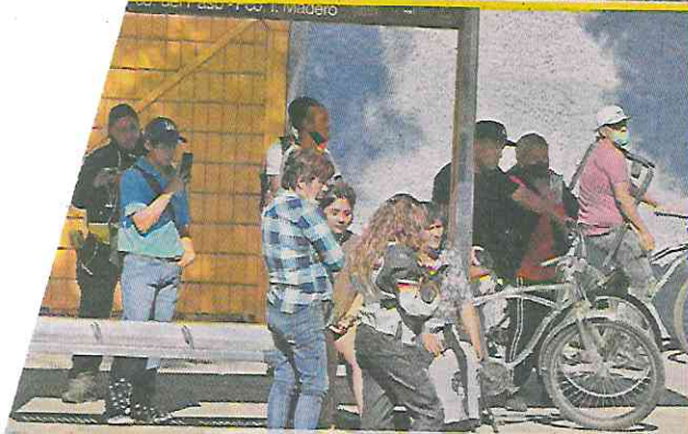
Varias personas se detuvieron a ver lo ocurrido pero nadie reconoció al occiso.

DERRAPA MOTOCICLISTA, IMPACTA LA CABEZA EN EL PAVIMENTO Y FALLECE