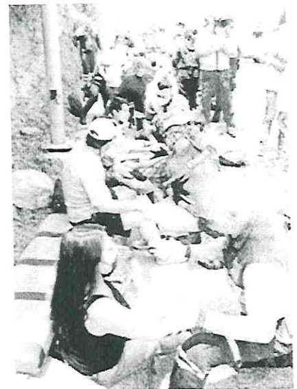
Iban llegando a la Ciudad de México, cuando la combi impactó por detrás al tráiler LUIS A. BARBERA

Por estos hechos, el Ministerio Público dio inicio a la carpeta de investigación correspondiente por los delitos de lesiones, daño en los bienes y lo que resulte contra quien sea responsable.