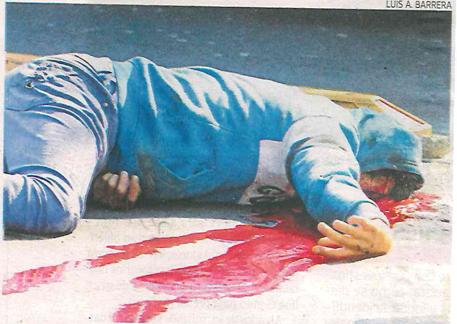
Tras caer, por chocar con los bolardos, se golpeó fuertemente el cráneo

Nada lo pudo salvar de la muerte, pues aún, cuando tenía el casco, no lo usó de manera adecuada por lo que no lo pudo ayudar durante el accidente, pues su casco golpe de lleno el pavimento.