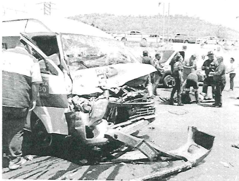
Todos los pasajeros resultaron policontundidos; en la cabina reinó pánico y dolor / LUIS A. BARRERA