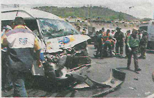
El impacto fue brutal

El choque se registró la tarde de ayer, a la altura del Parque Nacional Tepeyac, antes de llegar al Paradero del Metro Indios Verdes, donde la unidad de transporte público de la Ruta 30 intentó rebasar al