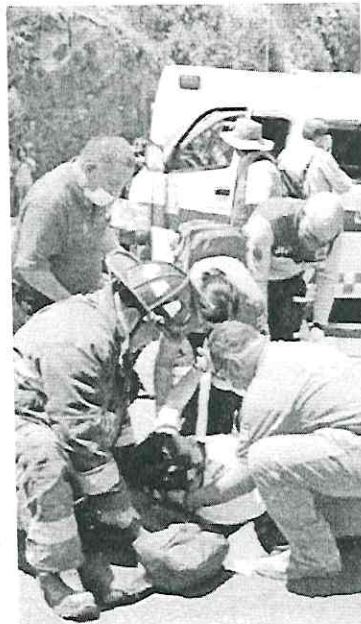
Tres de los viajeros prácticamente volaron dentro de la colectiva LUIS A. BARBERA