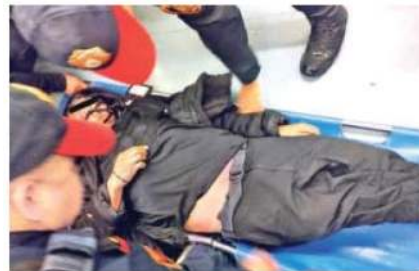
El deceso del adulto mayor ocurrió en el Metro Taxqueña

Los paramédicos llegaron buscando reanimar sin éxito al hombre, ante la mirada de algunos de los usuarios que fueron evacuados, quienes buscaban enterarse de los pormenores del hecho. El diagnóstico, en ese momento aún sin confirmar, fue un probable infarto.