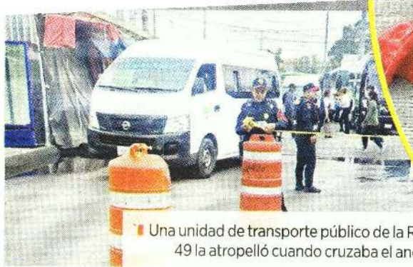
■ Una unidad de transporte público de la Ruta 49 la atropelló cuando cruzaba el andén C.

BUEN VECINO No se supo si la colcha de Spider-Man con la que la taparon era de ella o de los comerciantes.