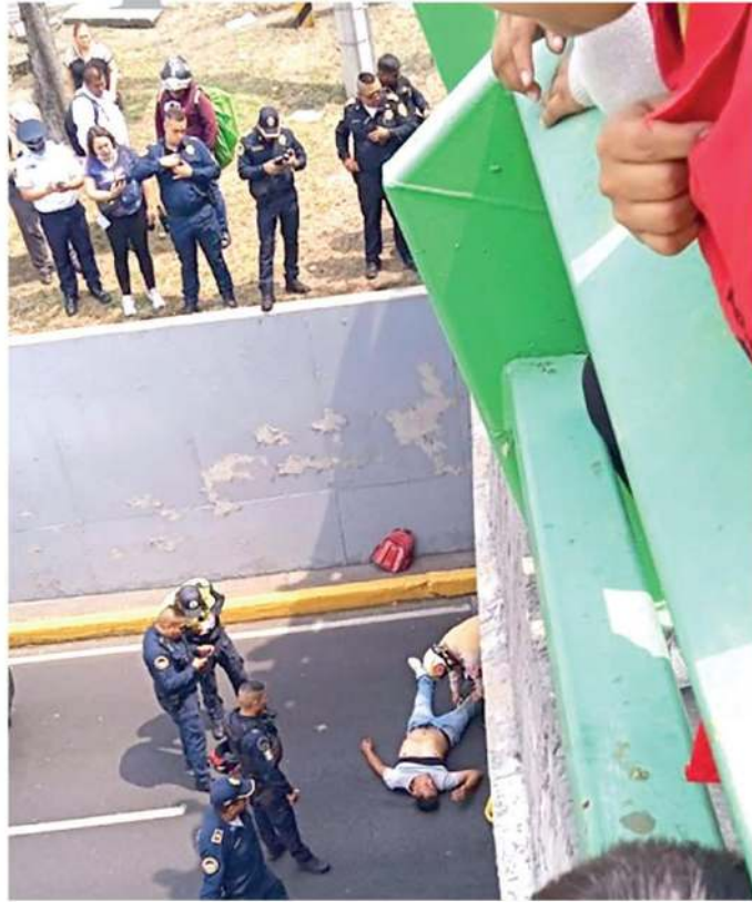
El golpe fue brutal, pero lo resistió