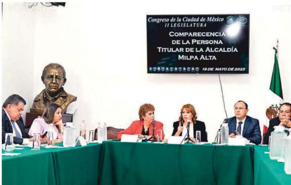
La servidora pública dijo que para mejorar las condiciones de vida se cuenta con cinco programas sociales, que concentra un presupuesto de 127 millones de pesos