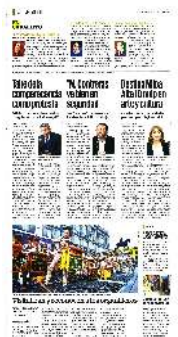
M. Contreras es la segunda alcaldía más segura: Quijano.