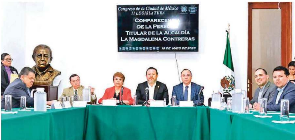
Ayer el alcalde de la Magdalena Contreras, Luis Gerardo Quijano Morales, compareció ante diputados del Congreso local

Al tercer trimestre del año, en la MC la percepción de inseguridad bajó de por arriba de un 72%, a alrededor de un 52%, poco más de 20 puntos porcentuales, señala Luis Quijano Morales