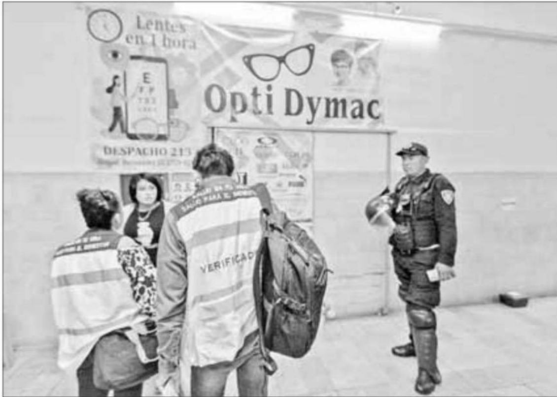
▼ Verificadores revisaron que los locales tuvieran personal especializado y medidas sanitarias.