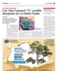
Alan Natanael "N" fue detenido en la colonia Centro