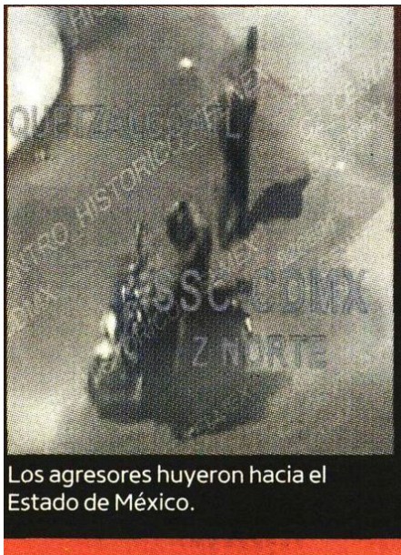
Los agresores huyeron hacia el Estado de México.