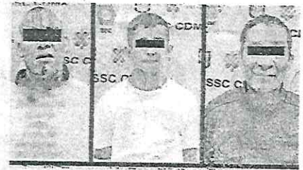
Apañados con buen surtido de hierba vaciladora para su venta

licial, a los tres hombres les fue realizada una revisión preventiva, tras la cual les fueron encontradas 36 bolsitas y una bolsa más con un aproximado de un kilogramo de una yerba verde similar a la marihuana.