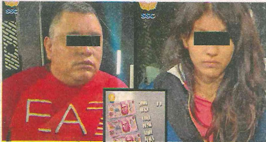
La policía capitalina hizo la detención en calles de la colonia Citlalli, alcaldía Iztapalapa

A las dos personas les fue indicado el motivo de su detención y tras leerles su cartilla de derechos constitucionales, fueron presentados junto con el automóvil, el dinero y la posible droga asegurada, ante el agente del Ministerio Público correspondiente, quien determinará su situación jurídica.