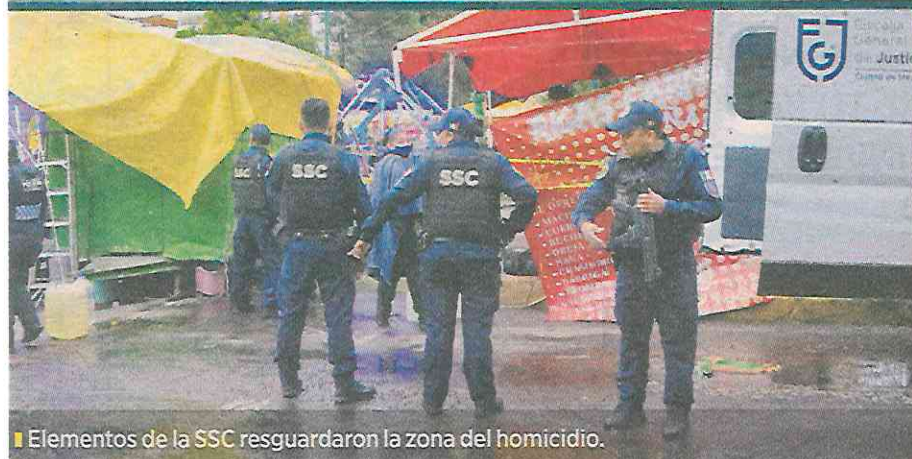
Elementos de la SSC resguardaron la zona del homicidio.