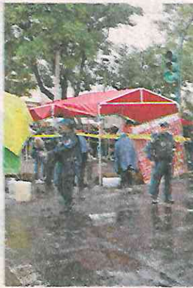
Zona acordonada en la alcaldía de Benito Juárez

Las primeras investigaciones de la policía del gabinete de seguridad del Gobierno de la Ciudad de México señalan que el crimen fue cometido por solitario sicario, quien tras ultimarle se dio a la fuga, por lo que sigue siendo buscado por la policía uniformada de la Secretaría de Seguridad Ciudadana de la CDMX y agentes de la Policía de Investigación de la FGJCDMX, a fin de ser localizado, detenido y llevado a prisión.