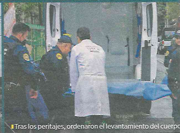
Tras los peritajes, ordenaron el levantamiento del cuerpo