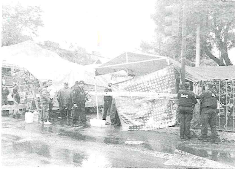
Le dieron a llenar