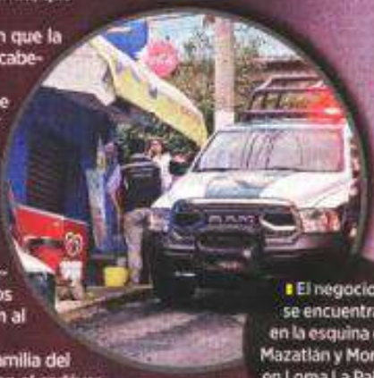
El negocio se encuentra en la esquina de Mazatlán y Morelia, en Loma La Palma, GAM.