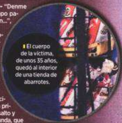
El cuerpo de la víctima, de unos 35 años, quedó al interior de una tienda de abarrotes.

Después de entrevistar a la familia del hombre, las autoridades levantaron el cadáver para trasladarlo a un anfiteatro ministerial.