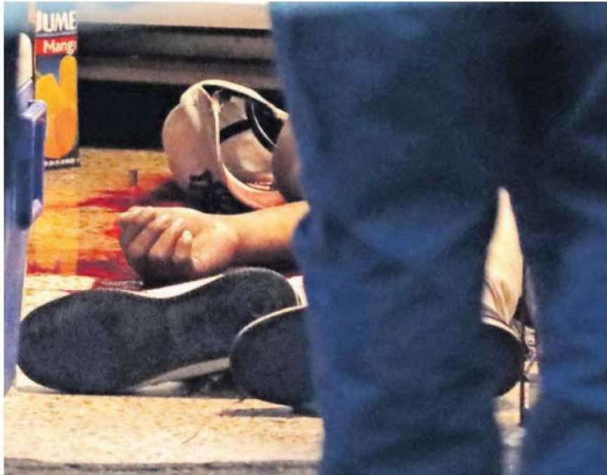
Tres proyectiles hicieron blanco en el cuerpo del hombre, uno fue a la cabeza, otro le entró por el pecho y uno más le dio en la pierna izquierda