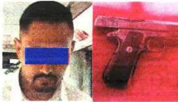
El hombre llevaba un arma al trabajo.

Ante esto, al chofer le fue retirado el "Certificado de Idoneidad", por lo cual no podrá prestar servicio de manera definitiva en ninguna de las líneas del Metrobús.