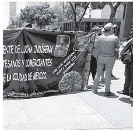
• Causaron caos vial en el Centro

fue agredida por policías; se desconoce su estado de salud