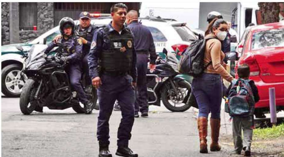
Inseguridad. Habitantes de nueve alcaldías de la CDMX se han sentido más inseguros en el último trimestre.

□ Cinco de cada 10 no se sienten seguros en Magdalena Contreras (56.3%), Venustiano Carranza (51.3%), Milpa Alta (54.6%), Tlalpan (50.8%).