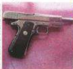
El operador fue hallado en posesión de un arma de fuego.