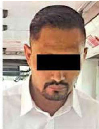
El operador de Metrobús detenido ayer con un arma.

Los ocupantes de un tercer auto grabaron los hechos.