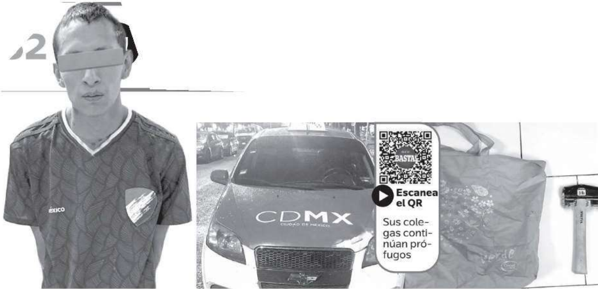
El detenido y lo asegurado fue trasladado al Ministerio Público