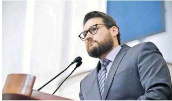
El diputado panista Aníbal Cañez aclaró que seguridad sobre la autopista, no es un asunto político