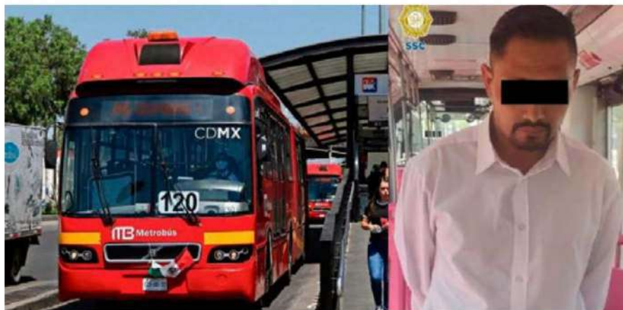
El conductor involucrado fue llevado ante el Ministerio Público para determinar su situación legal.