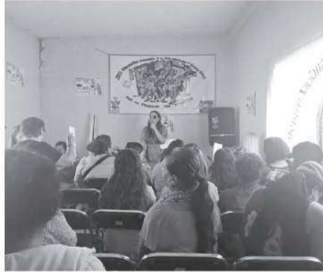
- Abordaron diversos temas sobre su labor