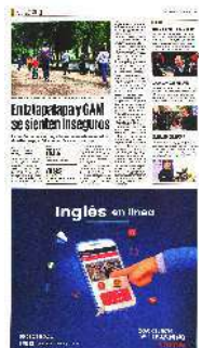
Benito Juárez (19.8%) y Cuajimalpa (20.4%) son las alcaldías con el menor índice de percepción de inseguridad.