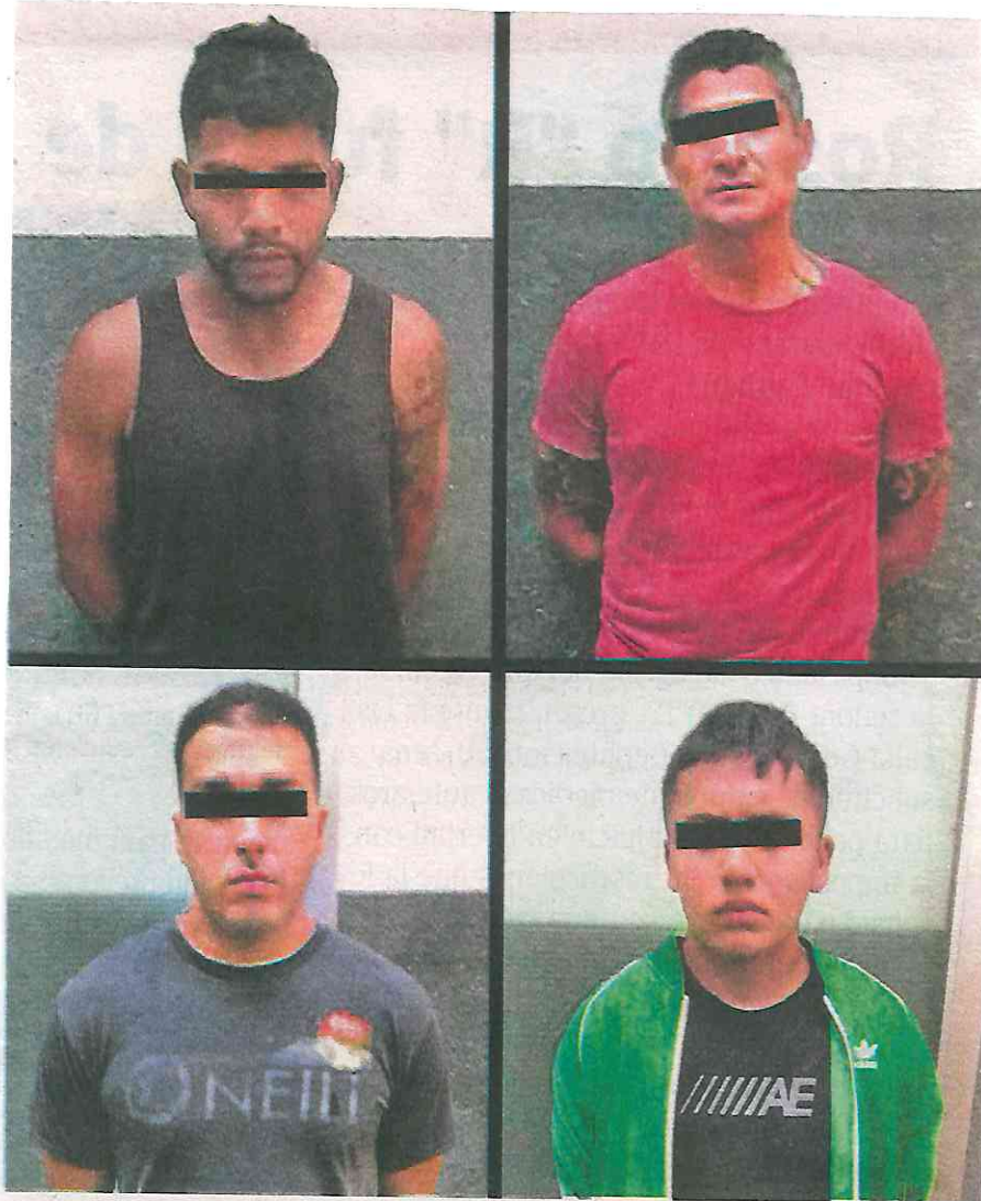
Diego "R" alias El Kalusha, Juan Alvino "R", alias Juanito; Carlos Antonio "H", alias El Cubano, y Ángel "G", alias El Cabezas, presuntos vendedrogas