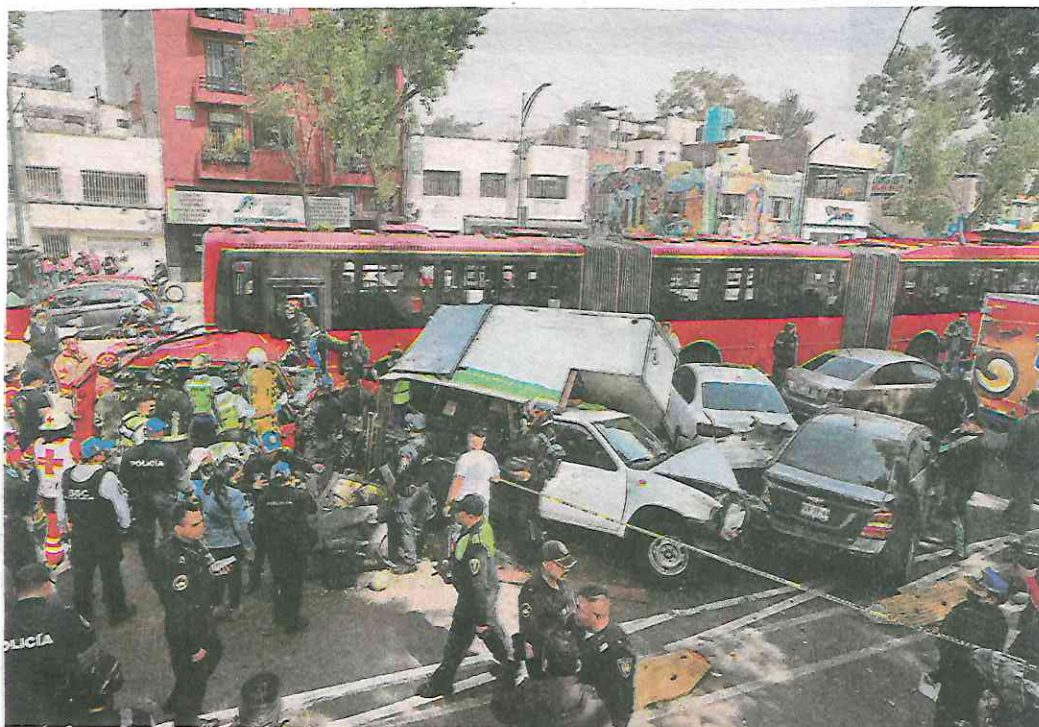
Camioneta provoca carambola en Insurgentes Norte al invadir carril confinado; choca por alcance contra una unidad del Metrobús