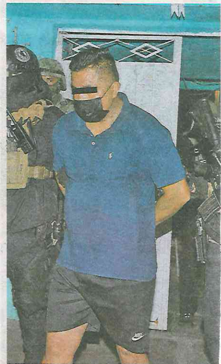
Operativo antidrogas en la colonia Peñón de los Baños; hay dos detenidos /GUILLERMO PANTOJA