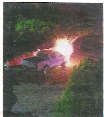
IZQ.: el presunto líder criminal, tras su detención y un vehículo quemado en Colima.