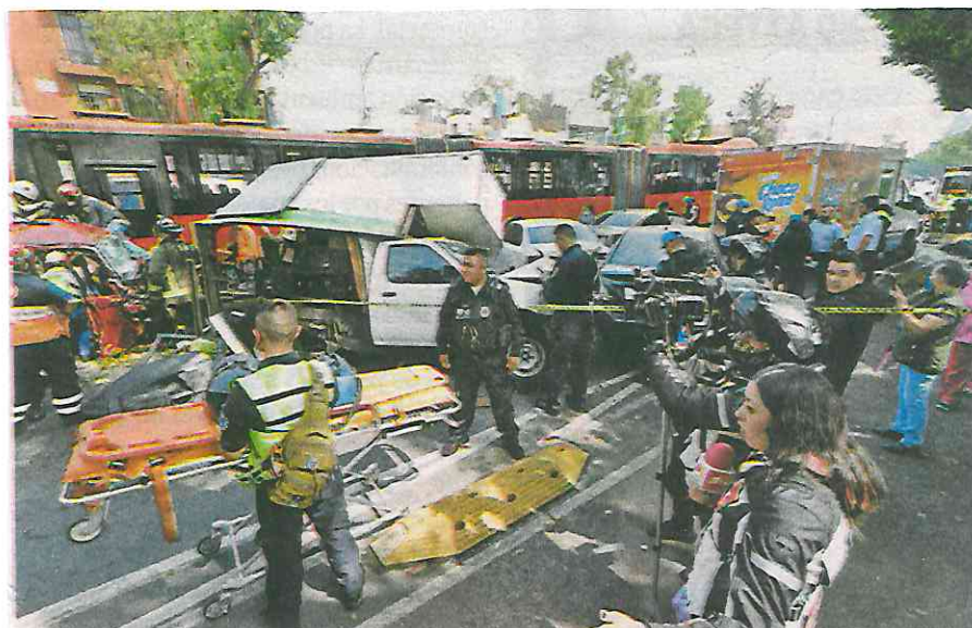
En el choque múltiple siete vehículos particulares se vieron afectados