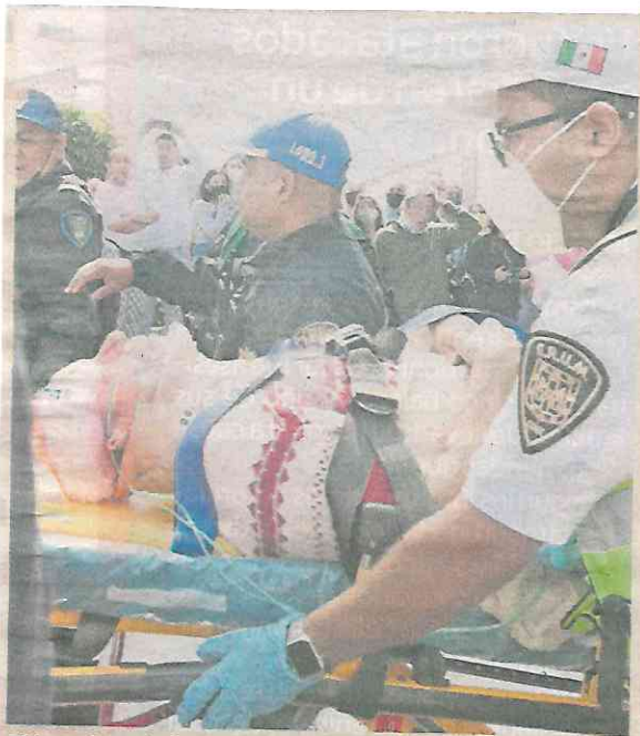
El hombre de la tercera edad invadió el carril confinado del Metrobús.