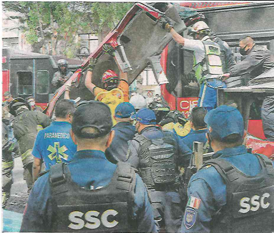
Se estampó con la parte trasera del Metrobús