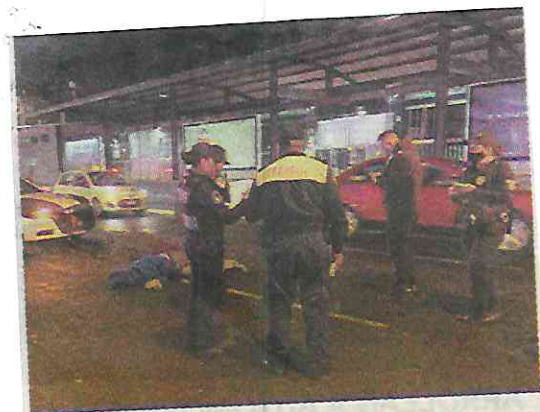
PLANCHAN A CICLISTA EN LA COLONIA ROMA Un ciclista perdió la vida tras ser arrollado por una camioneta que se dio a la fuga; esto ocurrió sobre la Avenida Cuauhtémoc y Eje 3 Sur, en la colonia Roma, alcaldía Cuauhtémoc.