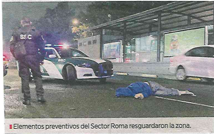
■ Elementos preventivos del Sector Roma resguardaron la zona.