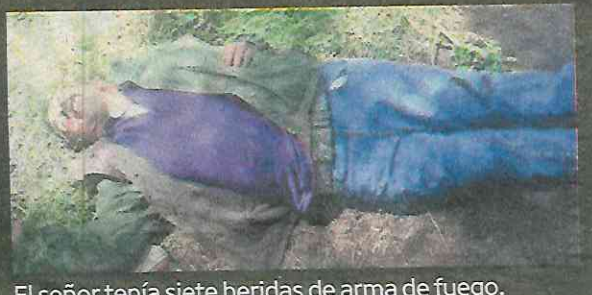
El señor tenía siete heridas de arma de fuego.

En la zona del doble homicidio no hay cámaras de vigilancia, por eso los agentes buscan imágenes en los dispositivos de domicilios cercanos, para dar con los asesinos. Los cuerpos de ambas víctimas fueron trasladados al anfiteatro de la agencia ministerial, en donde se espera que sean reclamados.