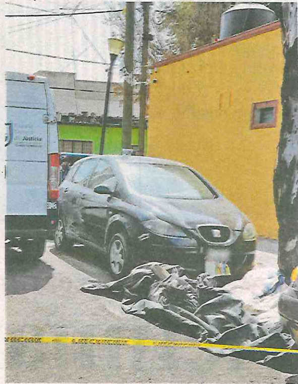
Frente a su negocio creyó ver bolsas con basura, pero contenían un cadáver embolsado

Cuando elementos de la Secretaría de Seguridad Ciudadana (SSC) llegaron hasta el sitio para inspeccionar las diversas bolsas, observaron que se trataba de una mujer, la cual se encontraba maniatada con los brazos y piernas unidos por la espalda con un alambre de cobre.