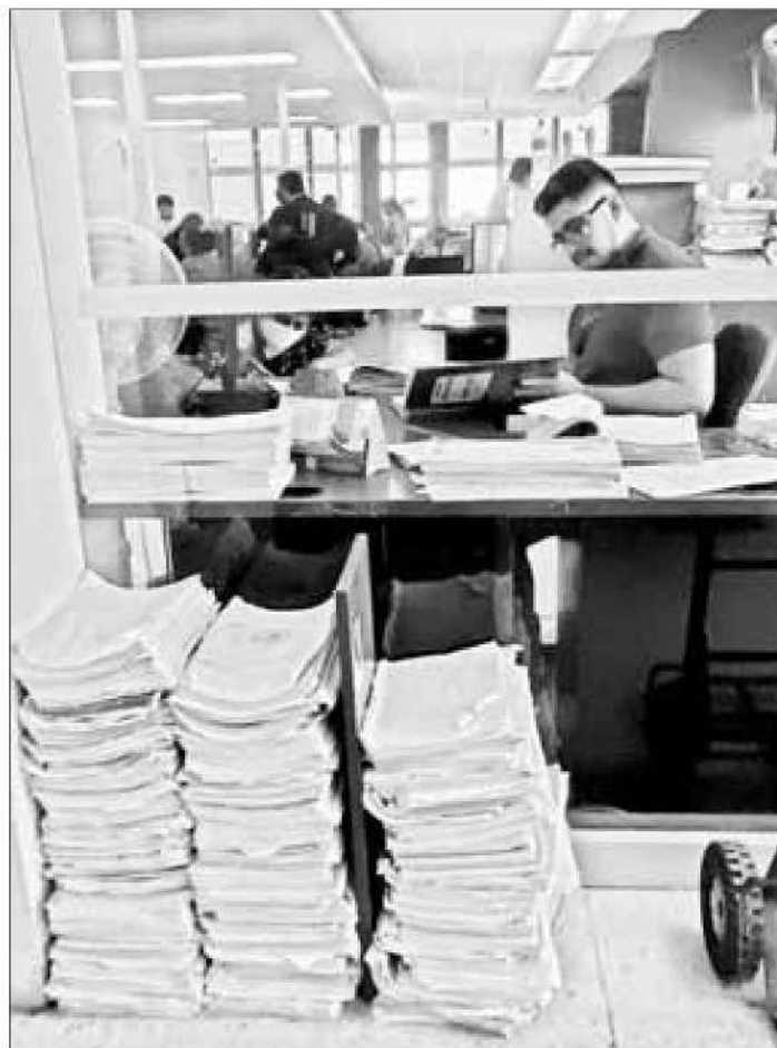
◀▲ En las agencias del Ministerio Público los servicios se encuentran rebasados. Trabajadores admiten que la enorme carga de trabajo deriva en el mal trato a los denunciantes.