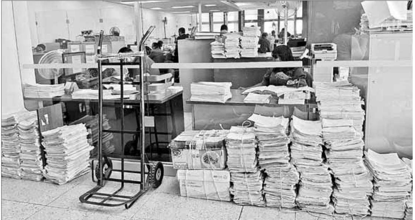
► Ante la falta de espacio, los expedientes de cientos de casos se encuentran en escritorios, sillas e incluso en el piso.