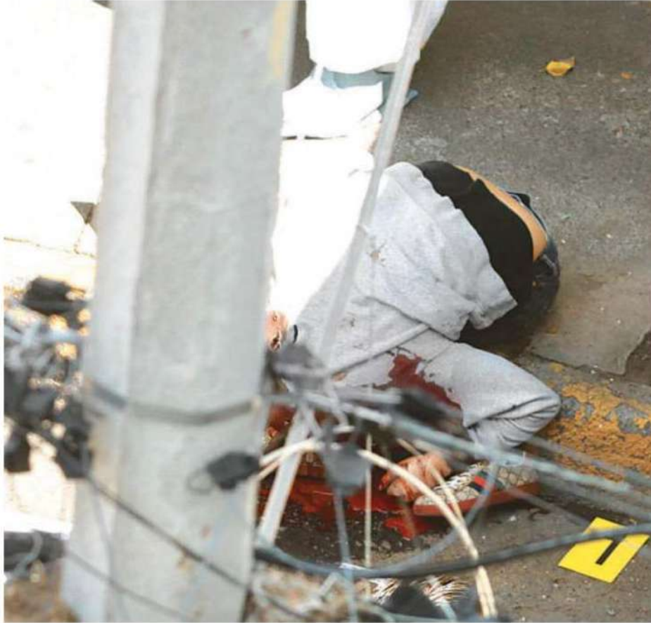
Elementos de la SSC hallaron a la víctima sentada sobre la banqueta doblado hacia adelante, un hombre de aproximadamente 25 años de edad inconsciente y ensangrentado con lesiones por arma de fuego