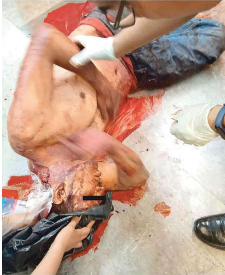
Un hombre apuñalado fue atendido y llevado a un hospital donde lucha contra la muerte