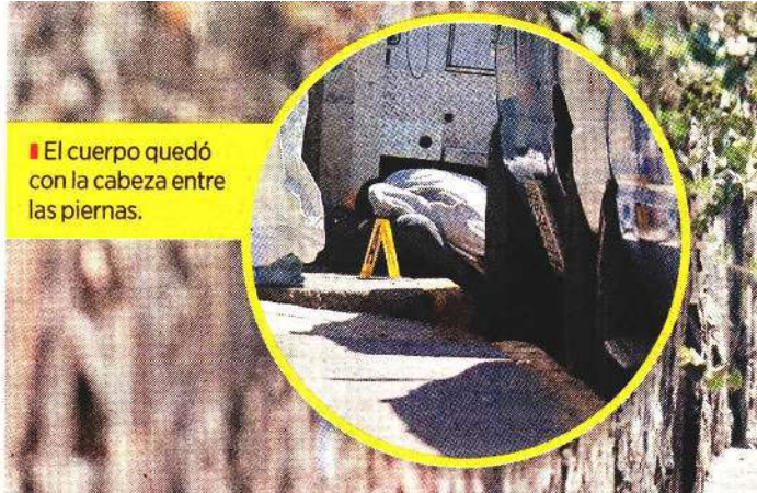
El cuerpo quedó con la cabeza entre las piernas.