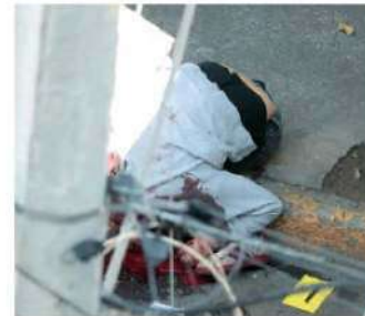
Así colgó el pico

La Fiscalía General de Justicia capitalina sigue como principal línea de investigación un posible ajuste de cuentas, ya que los asesinos llegaron a disparar en forma directa contra el masculino