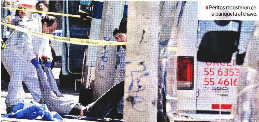
Peritos recostaron en la banqueta al chavo.