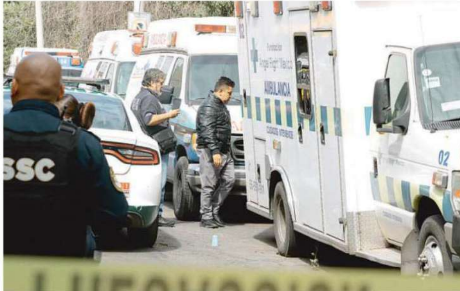
Entre dos ambulancias quedó el cuerpo sin vida en las inmediaciones de la Colonia Magdalena de las Salinas en la alcaldía Gustavo A. Madero