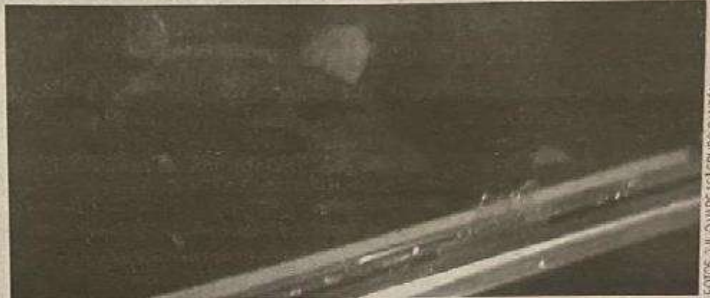
No le dieron tiempo de reaccionar

4 casquillos percutidos fueron hallados en el escenario del crimen