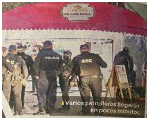
Varios patrulleros llegaron en pocos minutos.