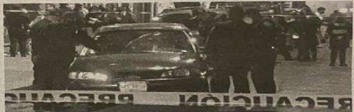
Decenas de personas fueron testigos del mortal ataque

gación (PDI) y peritos de la Fiscalía capitalina para hacerse cargo de las pesquisas y encontraron indicios de un posible ajuste de cuentas, ya que el ataque contra el automovilista fue en forma direc-