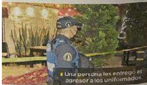
Una persona les entregó el agresor a los uniformados.

Después los paramédicos trasladaron a los dos lesionados a un hospital cercano.