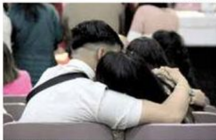
• AMOR. Los enlaces, en tres reclusorios.