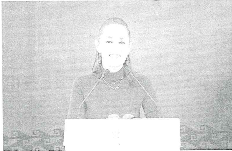
Forstays de (un) en el (un) que ha comen que cubras abuse de su poder Especial