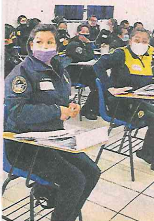
■ En el diplomado de la CDMX participan 54 mujeres y 36 hombres.

El diplomado forma parte de las medidas establecidas en la Ciudad de México desde 2019, cuando se emitió el decreto de alerta de violencia de género.