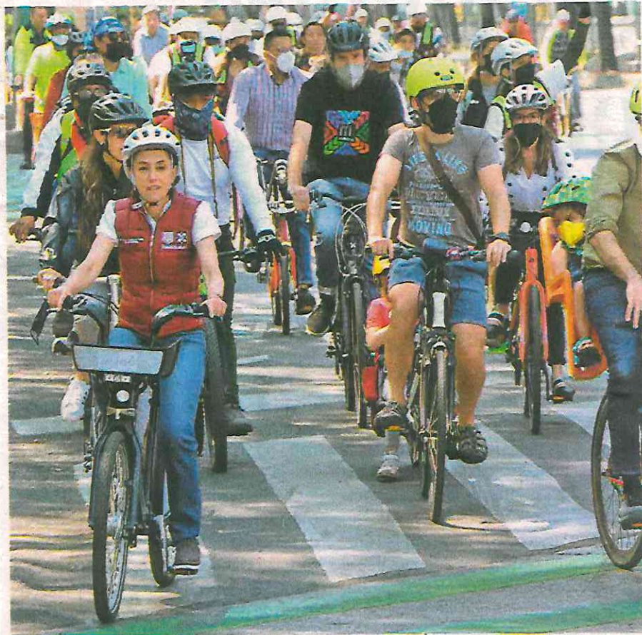
Claudia Sheinbaum encabezó la rodada por la ahora permanente ciclo vía de Insurgentes

gente y se realizaron aforos ciclistas para monitorear la evolución del tránsito.