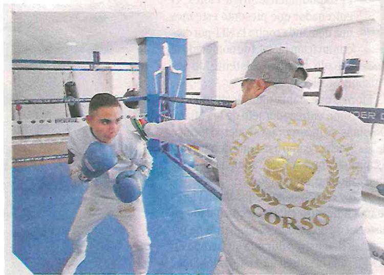
En el Gimnasio del Instituto de educación Superior de la Policía Auxiliar Juan Martínez trabaja todos los días e invita a la ciudadanía a practicar un deporte.

quien entrena de 13.00 horas a las 16:00 el horario que está abierto para todos.