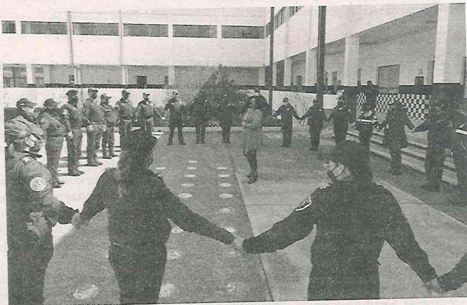
SSC garantizará vida libre de violencia para niñas y mujeres

El Diplomado de Actuación Policial y Atención a Víctimas con Perspectiva de Género, diseñado por la Semujeres, tiene por objetivo que las y los policías de la capital tengan las herramientas necesarias para detectar e identificar de manera oportuna los casos de violencia en diferentes contextos y desarrollar competencias para la prevención desde la perspectiva de gé-