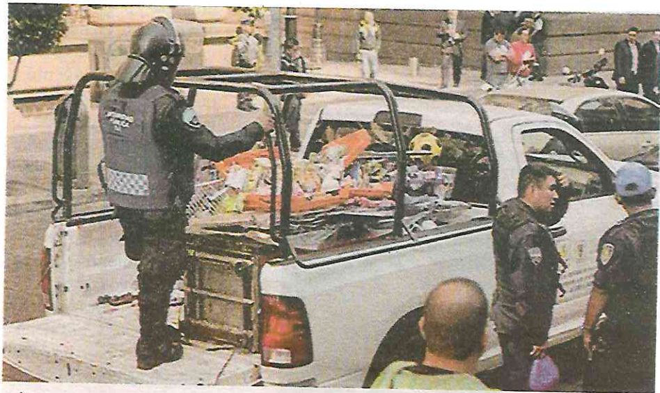
Los que no pagan pierden sus mercancías