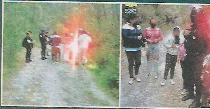
SSC Encontró a las menores después de que pidieran apoyo.

Los policías pidieron apoyo vía radio, minutos después fueron localizadas las tres menores en las inmediaciones de la zona conocida como Transmetropolitana, a tres kilómetros al interior del bosque.