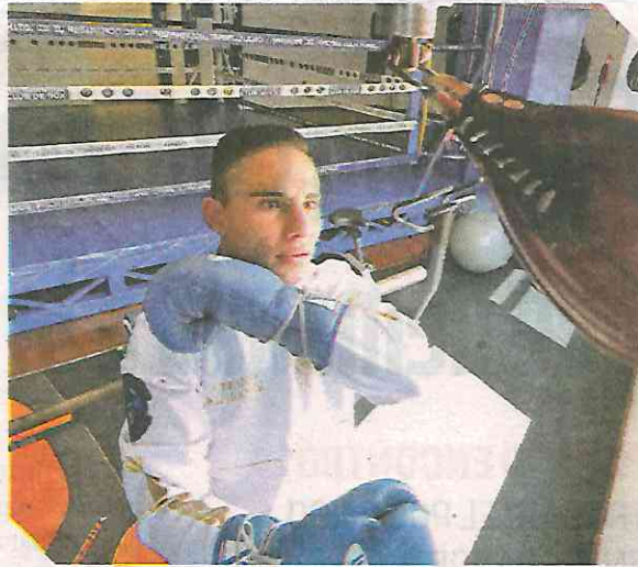
El elegante Martínez un ejemplo para los niños y los jóvenes.