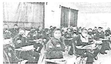
Ante la ola de manifestaciones feministas, agentes de la policía son capacitadas sobre temas de género. Especial

perspectiva de género y finalmente una Clínica Interinstitucional de Atención a Víctimas, donde visitarán los espacios de la Semujeres, las Unidades Territoriales de Prevención y Atención a la violencia de Género, LI NAS y módulos de las Abogadas de las Mujeres. Además el diplomado será impartido por las tres Direcciones Ejecutivas de esta dependencia (Igualdad sustantiva, Acceso a la justicia y Vida libre de violencia).