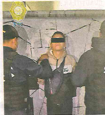
El presunto homicida fue detenido por uniformados de la Secretaría de Seguridad

El joven caminaba cerca de la entrada del metro de la Línea 1 a un costado de los puestos ambulantes, cuando de pronto fue atacado con un arma punzocortante