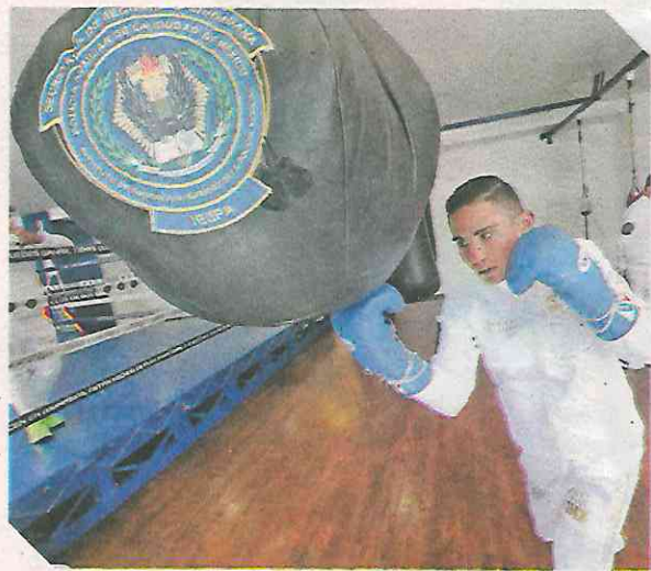
Desde las 6:00 de la mañana inicia sus actividades para ser un buen deportista y policía.