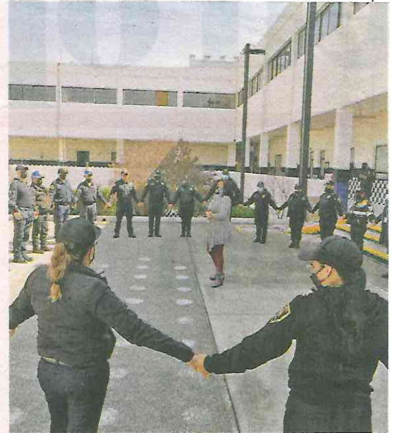
Imparten capacitación con perspectiva de género a elementos de la SSC

La dependencia detalló que el Diplomado de Actuación Policial y Atención a Víctimas con Perspectiva de Género diseñado por la Semujeres tiene por objetivo que las y los policías de la capital tengan las herramientas necesarias para detectar e identificar de manera oportuna los casos de violencia en diferentes contextos y desarrollar competencias para la prevención desde la perspectiva de género y con enfoque de derechos humanos y así otorgar