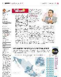
Gráfico: Rodolfo Gómez