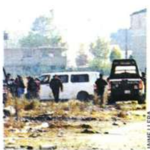
JAI ME LLERA