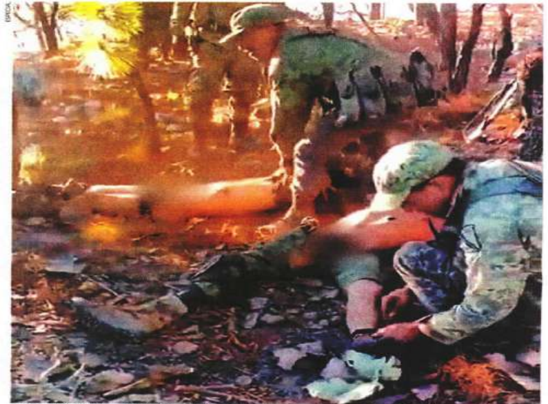
Videos de la matanza que circulan en redes sociales muestran cómo miembros de Los Tlacos apilan los cadáveres que presentan el tiro de gracia, se burlan, les quitan las botas y les prenden fuego.