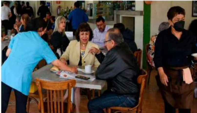
Esta situación puede afectar la dinámica de crecimiento de la economía local y de los precios.

De acuerdo con el Instituto Mexicano de Ejecutivos de Finanzas (IMEF), este escenario no solo impacta directamente en la dinámica de crecimiento de la economía local y los precios, si-