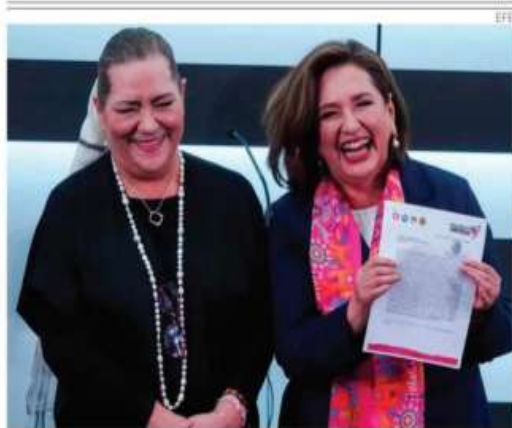
Guadalupe Taddei, presidenta del INE, entregó el registro a Xóchitl Gálvez.

nen grupos criminales para movilizar a la gente, y con esa base se dan el lujo de pactar treguas para frenar enfrentamientos entre ellos, como es el caso entre 'Los Tlacos' y 'Los Ardillos'. PAG 6