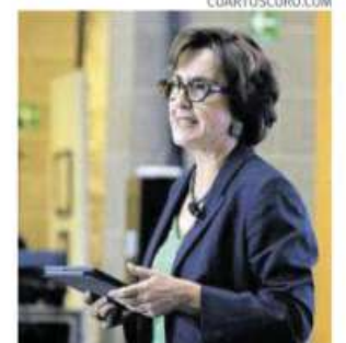
Acusa diferencias y se cree que es por la llegada de nuevas personas.