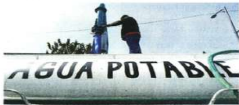
Algunas alcaldías cuentan con sólo 17 pipas para atender hasta 200 mil personas con problemas de abastecimiento.

Con sus propios recursos y sin especificar el mon-