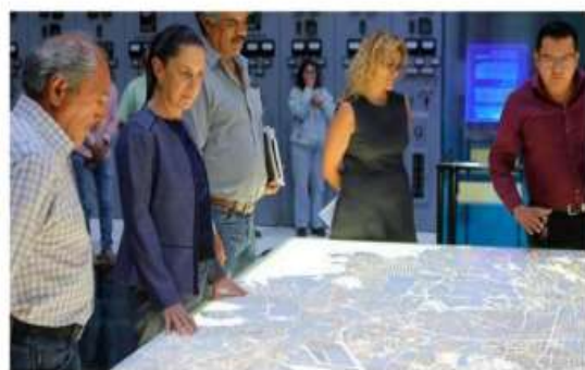
Claudia Sheinbaum pide a la población reducir el consumo de agua.

Además, este año se destinarán 300 mdp para instalar más de 2 mil sistemas de cosecha de lluvia en escuelas públicas, beneficiando a más de 932 mil personas en la comunidad educativa. Esta iniciativa contribuye no solo al ahorro de agua, sino también a la reducción de emisiones contaminantes y al fortalecimiento de la conciencia ambiental. (Gerardo Mayoral)