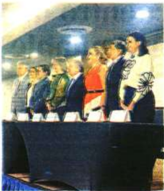
La secretaria de Turismo de la Cdmx dijo que el sector representa el 9.1% del PIB de la capital. /PATRICIA CARRASCO

Comentó que al mismo la Secretaría de Turismo del Gobierno Federal entregará este día 35 Credenciales a Consultores Certificados; 107 estándares de Calidad a 50 prestadores de servicios integrados de la siguiente manera: uno de Moderniza Especializado; ocho de Moderniza Básico; tres de Punto Limpio; 95 Distintivos "H" y 109 Constancias de Clasificación Hotelera.