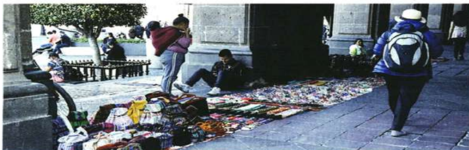
LOS CONTRASTES. Pese a estar prohibido por la norma, el comercio informal es tolerado dentro del Perímetro A del Centro.

En marzo de ese año, el Reglamento de Cementerios fue sustituido por el de Cementerios, Crematorios y Servicios Funerarios, con el objetivo de mejorar las condiciones de seguridad y operación y evitar casos similares.