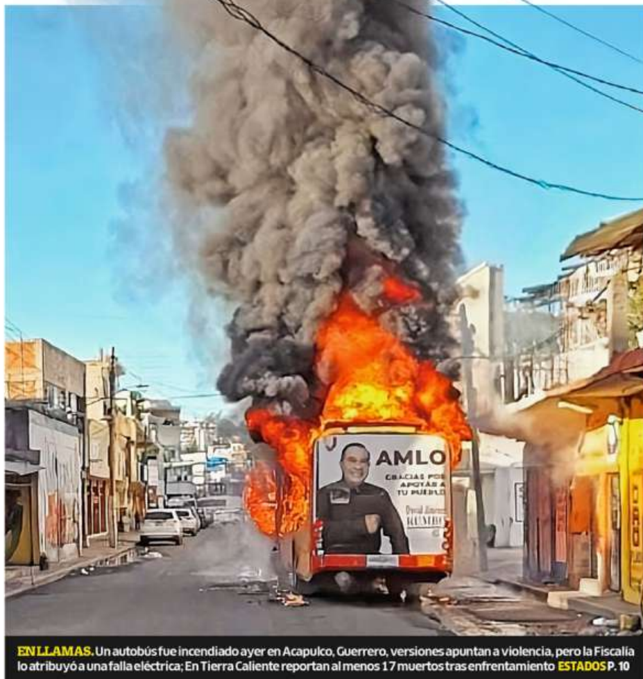
ENLLAMAS. Un autobús fue incendiado ayer en Acapulco, Guerrero, versiones apuntan a violencia, pero la Fiscalía lo atribuyó a una falla eléctrica; En Tierra Caliente reportan al menos 17 muertos tras enfrentamiento ESTADOS P. 10

En el arranque del año se ha registrado un asesinato al día de uniformados, en promedio; la mayoría en Guanajuato, Edomex y Jalisco, de acuerdo con los reportes de la organización Causa en Común. Los días más violentos para este sector fueron el 7 y 8 de febrero, cuando al menos ocho policías fueron víctimas de homicidios y ataques en cuatro estados, entre ellos Guerrero, ubicado también entre las entidades con mayor número de crímenes en general, sólo en enero se registraron 145 casos, según datos oficiales ESTADOS P. 10