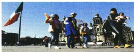
En el Zócalo se lleva a cabo una intervención para habilitarlo como espacio peatonal.

Precisamente, frente a este inmueble se ubica un grupo de personas que se presentan como integrantes de comunidades indígenas y