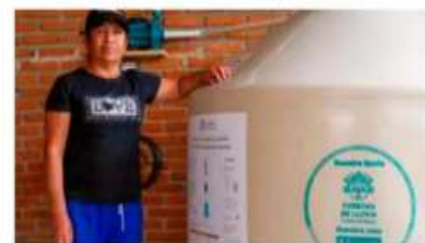
Programa de Cosecha de Lluvia.

Aunque el sistema Cutzamala, la principal fuente de agua, se encuentra a menos del 40 % de su capacidad y se pronostica que el 'día cero' podría llegar en julio, Sheinbaum expresó confianza en que la situación se revierta de forma natural, respaldada por conclusiones de expertos en cambio climático. (Gerardo Mayoral)