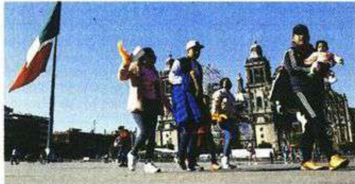
En el Zócalo se lleva a cabo una intervención para habilitarlo como espacio peatonal.

De acuerdo con el calendario del proyecto de peatonalización, la intervención se extenderá hasta el 18 de abril.