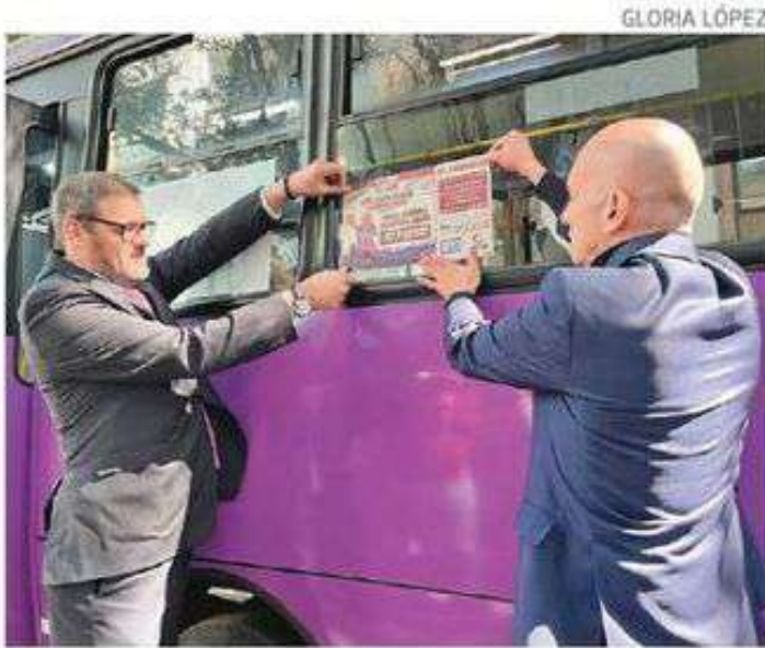
Los choferes sabrán cómo atender a víctimas