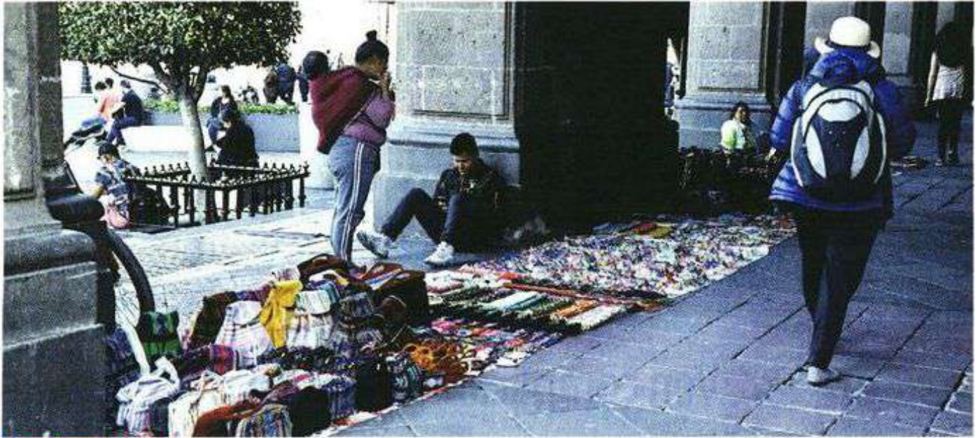
LOS CONTRASTES. Pese a estar prohibido por la norma, el comercio informal es tolerado dentro del Perímetro A del Centro.