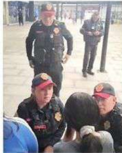
CASO. Los policías encontraron a la menor y tras verificar que estaba bien, fue entregada a su madre.

Por lo que conminó a los habitantes de la alcaldía a denunciar cualquier intento de extorsión a través del número de la Base Plata 55 52 72 02 22. /24HORAS