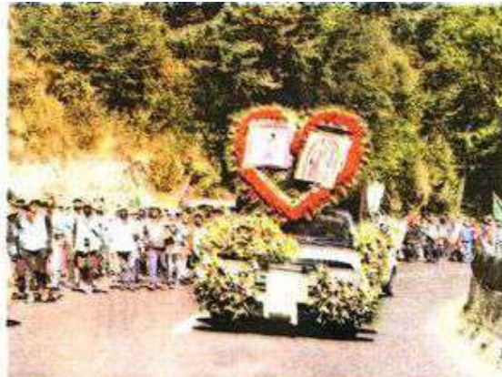
Más de 500 vehículos acompañan a los feligreses

caminaron en una primera etapa, poco más de 25 kilómetros, de la ciudad de Toluca a Ocoyoacac, y después a la alcaldía Cuajimalpa para dirigir su camino hacia la Basílica de Guadalupe