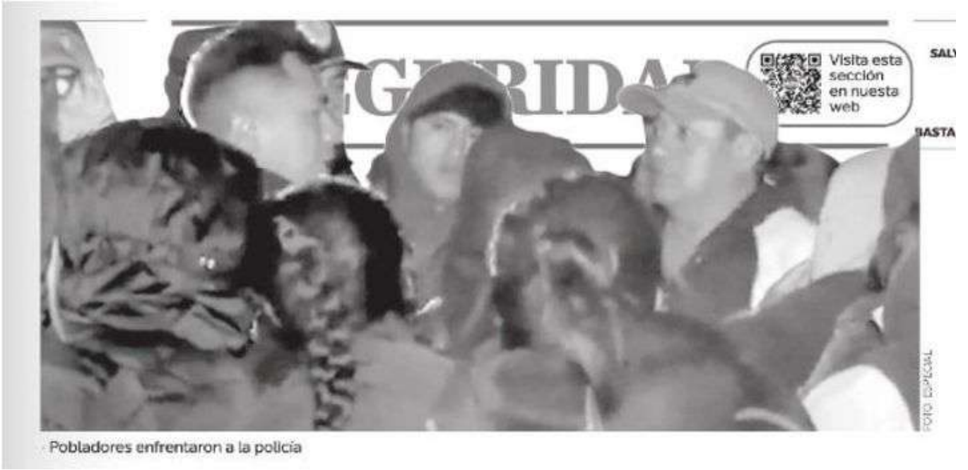
Pobladores enfrentaron a la policía