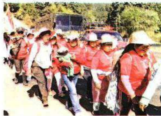
La fe guadalupana presente entre los integrantes de arquidiócesis mexiquense