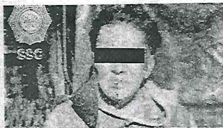
El sujeto utilizaba su teléfono celular para grabar a mujeres

Los oficiales en campo efectuaban sus labores de vigilancia sobre la avenida Pe-