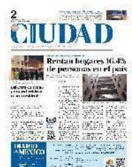
Los hechos se registraron el pasado domingo por la noche en esta zona de la colonia Morelos.