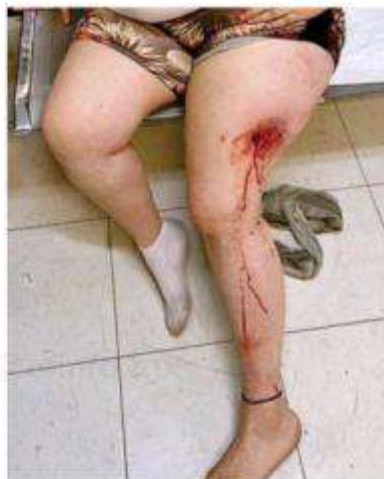
Sujetos en motocicleta abrieron fuego contra las personas

Una tía de la menor y dos personas más también resultaron lesionadas por las