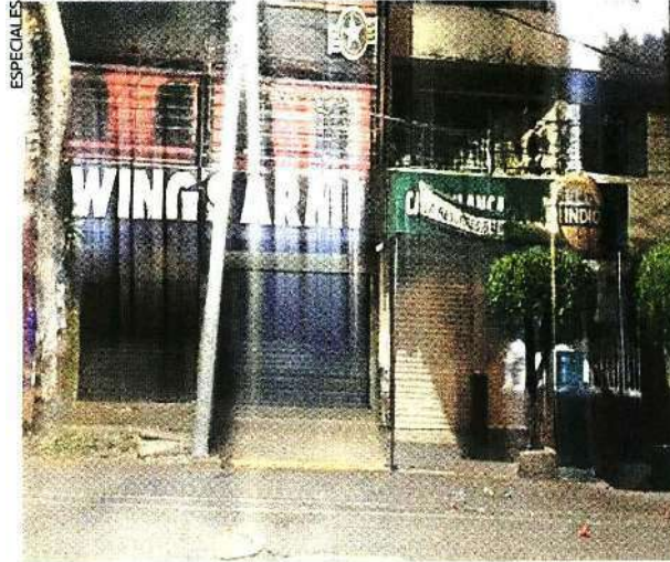
Los balearon cuando echaban chelas frente a la tiendita.