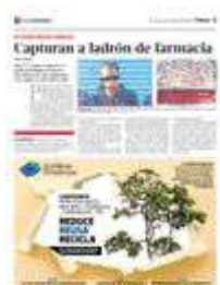
El imputado , identificado como Jorge "N", de 36 años de edad, fue puesto a disposición del Ministerio Público de la Fiscalía General de Justicia de la CdMx