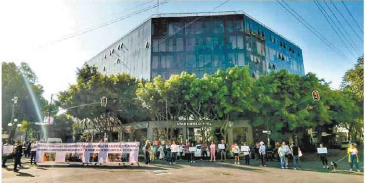
➤ Aproximadamente 30 personas de la colonia se dieron cita ayer en el cruce de General Prim y Versailles.