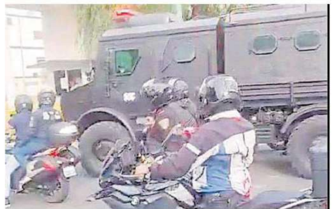
Un vehículo blindado Unimog , mejor conocido como Rino , ingresó al 365 de avenida Jardín para trasladar al presunto líder, custodiado por más de 10 unidades de diversos agrupamientos