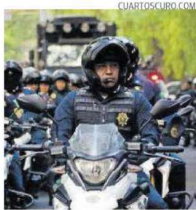
Se suman nuevos elementos a la alcaldía.