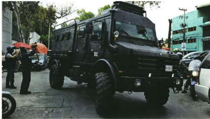
En medio de un fuerte dispositivo de seguridad se realizó el traslado de "El Chori", líder de La Unión Tepito, al Reclusorio Norte.

vehículos integraron el convoy que escoltó a "El Chori".