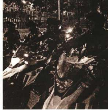
Ayer desplegaron el operativo