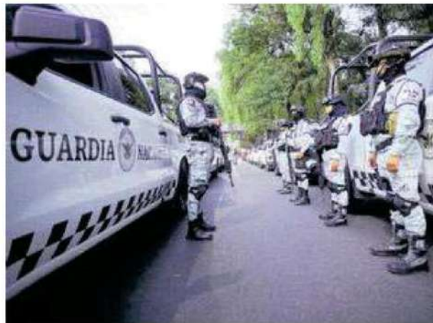
Invitan a vecinos que denuncien los delitos que se cometen en sus colonias

El objetivo es inhibir delitos como narcomenudeo, robo de vehículos y de transporte, así como ilícitos de alto impacto