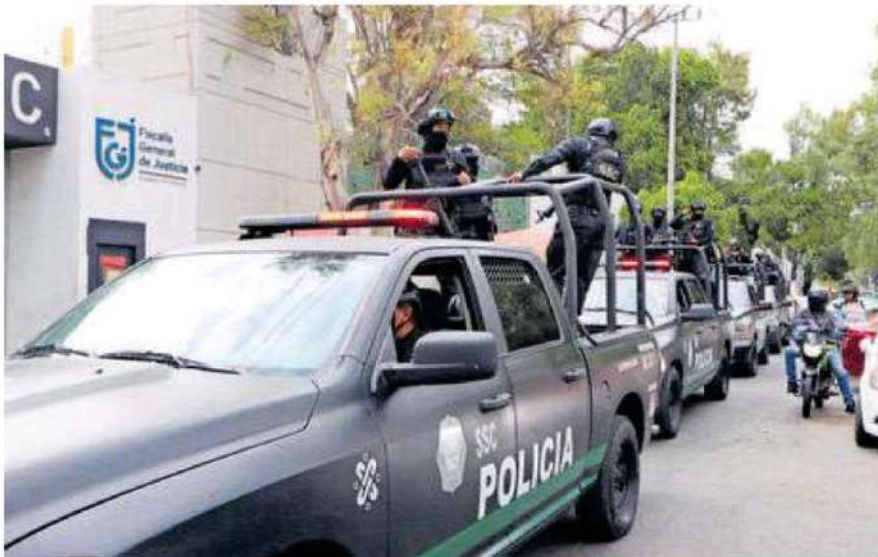
El Chori fue detenido por agentes de la Subsecretaría de Inteligencia e Investigación Policial del Gobierno de la CdMx, junto con su pareja sentimental