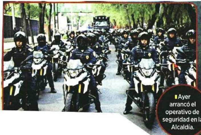
■ Ayer arrancó el operativo de seguridad en la Alcaldía.

También participarán la Fiscalía capitalina, con 30 elementos; la Secretaría de la Defensa Nacional, con 78; la Secretaría de Marina, con 18, y la Guardia Nacional, con 70, detalló el jefe de Gobierno, Martí Batres.