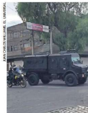
El Chori salió de las oficinas de la fiscalía en Azcapotzalco a bordo de un vehículo blindado tipo Rhino.

HELICÓPTERO de la policía sobrevoló el penal a la llegada del delincuente.