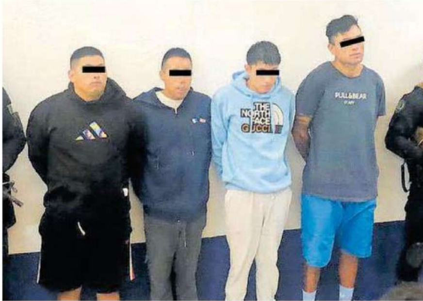
Los detenidos se dedicaban al robo de autopartes, vehículos, narcomenudeo y tráfico de armas en calles de la alcaldía Iztapalapa