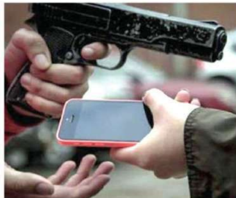
Los robos están a la orden del día

A través de esta acción se busca proteger a los residentes y combatir el narcotráfico, la extorsión y la violencia de género