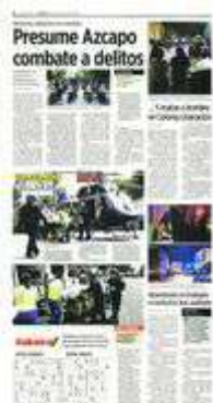
■ Ayer arrancó el operativo de seguridad en la Alcaldía.